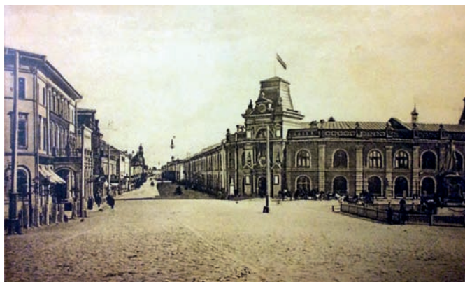
Рис. 5. Площадь Александра II и Воскресенская улица. Фото начала XX века

В свете этих намерений казанских властей очень своевременной оказалась предпринятая настоятелем Иоанно-Предтеченского монастыря инициатива по сносу расположенного напротив думы собора XVII века с последующим возведением на его месте нового. Редкий в русской архитектуре трёхшатровый храм был разобран несмотря на решительное возражение Московского археологического общества, признавшего в нём «замечательный памятник русского зодчества, который необходимо сохранить», и заключение такого авторитета как А.М. Павлинов [8]. Новый храм, построенный в 1887–1889 годах с «сохранением, по возможности, архитектуры старого», был сильно вынесен вперёд, архитектурно оформив южную сторону отчасти урегулированной таким образом площади. В 1895 году в центре её был установлен памятник «Царю-Освободителю» по победившему конкурсному проекту В.И. Шервуда. Среди прочих появившихся повсеместно монументов императору он выделялся бронзовыми фигурами зиланта, заимствованными из герба Казани 2 . В том же году в обновлённом северном корпусе гостиного двора разместился городской музей, отмеченный угловой башенкой над входом, а сама площадь