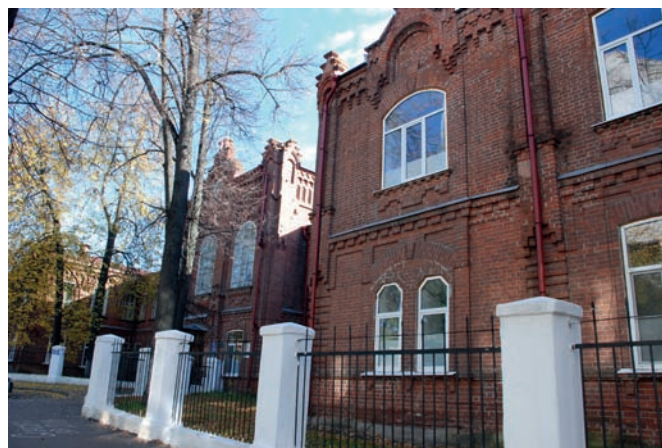
Рис. 2. «Новые» клиники Казанского университета. 2016 год

В отличие от других городов, обзаведшихся новыми зданиями городских дум в русско-народных формах, перестроенное в 1830–1840-х годы здание Казанского общественного самоуправления сохранило свой облик, отвечающий классицистическому образу Воскресенской улицы. Появившийся в начале 1880-х годов балконный портик ещё более усилил симметричность