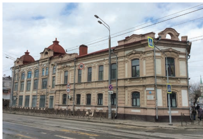
Рис. 8. Книгоиздательский комплекс братьев Каримовых. 2019 год

По примеру русских клубов – Дворянского и Купеческого собраний, был учреждён Восточный клуб для татар. Первоначально размещавшийся в номерах «Булгар» и доме Сабитовых на озере Кабан, он в 1910 году переехал в собственное трёхэтажное здание. В перестроенном доме купца Карима Апанаева с гардеробом, зрительным залом на 150 человек, библиотекой, комнатами для заседаний правления и игр в лото читали лекции, проводили диспуты, ставили спектакли, в том числе на русском языке, организовывали праздники, планировали создание национального музея [11, с. 94–95] 8 . Новые общественные здания демонстрировали изменение векового патриархального уклада жизни нации, её приобщение к духовным достижениям мировой цивилизации.