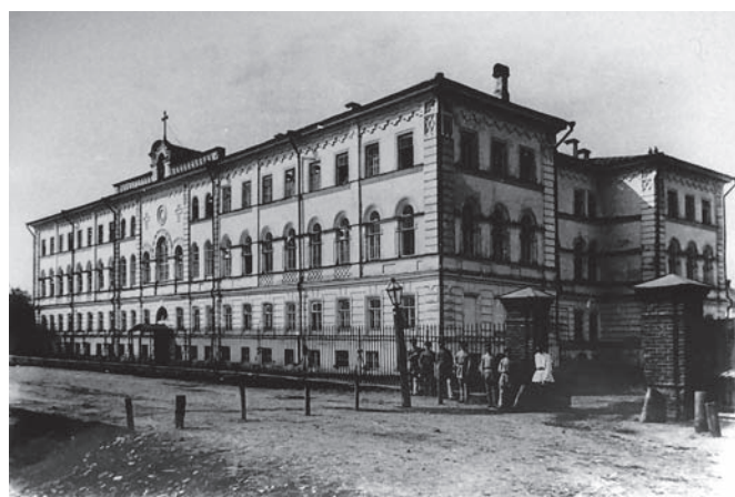
Рис. 3. Учительская инородческая семинария. Фото конца XIX века