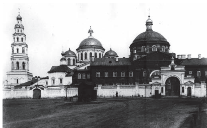
Рис. 4. Казанский Богородицкий монастырь. Фото конца XIX века