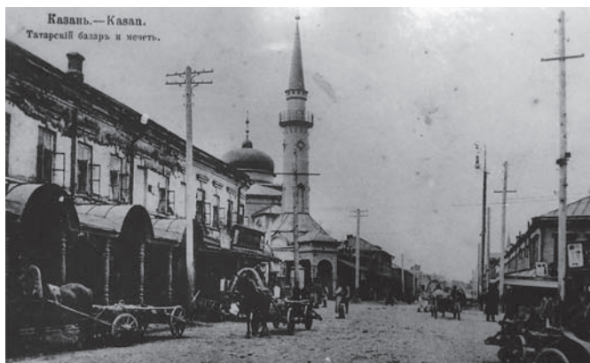
Рис. 6. Сенная площадь. Фото конца XIX века

вскоре была названа «Александровской» (рис. 5). Так, к концу XIX века (впервые со времени реализации регулярного плана) в городе появилось общественное пространство административного назначения. Ансамбль парадного центра Казани получил своё завершение, воплотившись как в старых доведённых, так и новых проектах. Его «классицистичность» вновь проявилась в начале XX века, в частности, в облике здания Казанского отделения Государственного банка России (1914–1915). Неоклассический фасад общенационального учреждения превалировал на конкурсе, предлагавшем в том числе варианты, выполненные в формах получившего распространение для этого типа зданий неорусского стиля.