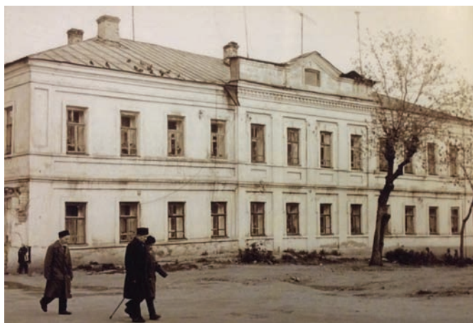
Рис. 7. Медресе «Марджания» при Юнусовской мечети. Фото середины XX века

житие, мастерские, стадион, превращавшийся зимой в каток, отвечали общей, непривычно свободной для конфессиональной школы обстановке учебного заведения, где выпускались рукописные газеты и журналы, ставились спектакли.