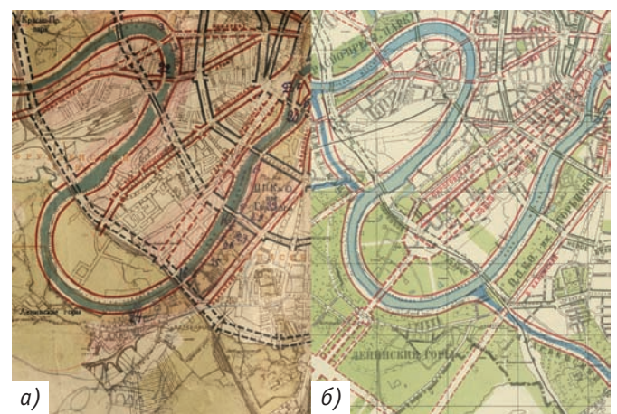
Рис. 6. Сопоставление схем планировки 1934-го (а) и 1935-го (б) годов. Варианты планировки Аллеи Ильича от Дворца Советов к Ленинским (Воробьёвым) горам