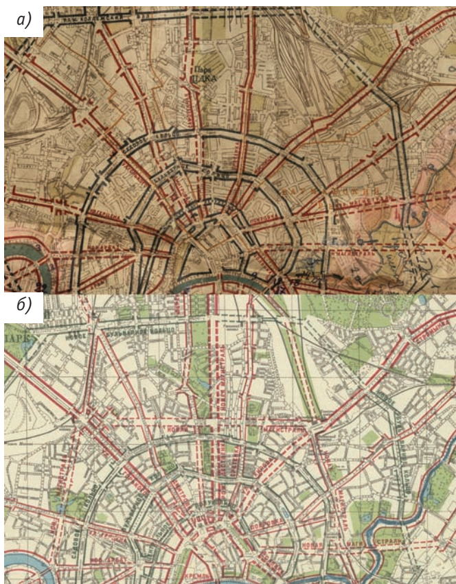
Рис. 4. Сопоставление схем планировки 1934-го (а) года и 1935-го (б) годов. На схеме 1935 года. показаны три «обходные» магистрали, которых нет на схеме 1934 года, а на схеме 1934-го – новая магистраль от Покровки в сторону Лефортово, которой нет на схеме 1935 года

Помимо очевидного отсутствия юго-западного района, а, следовательно, и всей сети намечавшихся на новой территории улиц, на схеме 1934 года также нет некоторых новых магистралей, которые планировалось прокладывать через уже существовавшую застройку. Прежде всего на схеме отсутствует так называемая магистраль «север–юг», идущая от Останкинского парка через Рождественку и центр на Ордынку и далее – на спрямлённое Серпуховское шоссе. Нет «обходных» магистралей, которые в 1935 году намечались: первая – от площади, образуемой Новым Арбатом у Москвы-реки, через площадь Белорусского вокзала к Савёловскому вокзалу, вторая – от площади Белорусского вокзала к Комсомольской