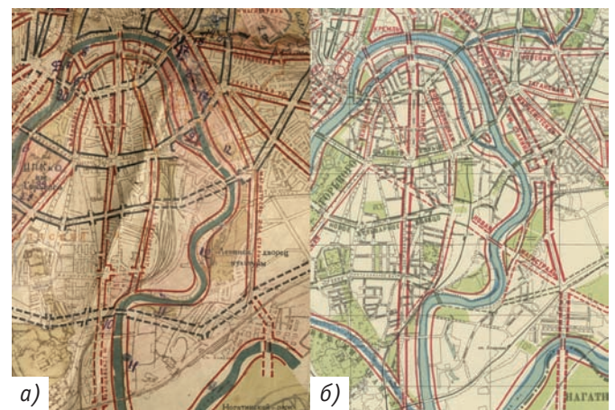
Рис. 5. Сопоставление схем планировки 1934-го (а) и 1935-го (б) годов. На схеме 1935 года показана новая магистраль от Октябрьской площади к Южному порту, которой нет на схеме 1934 года, а также изменённая трассировка Паркового кольца и Андреевский канал.