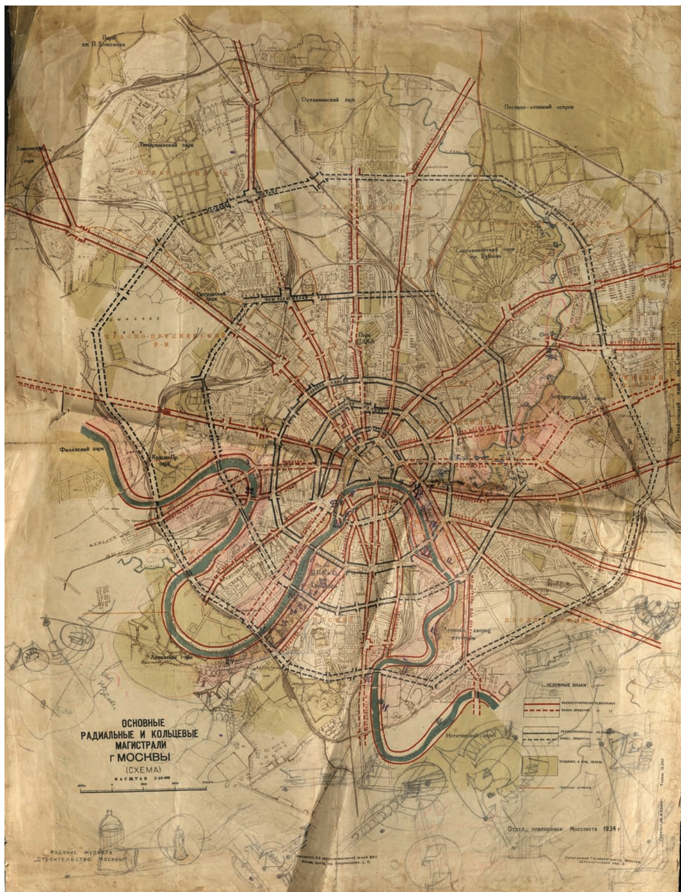
Рис. 2. «Основные радиальные и кольцевые магистрали г. Москвы» (схема). Отдел планировки Моссовета, 1934 год 5