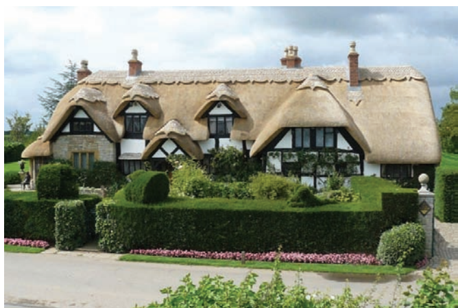
Рис. 4. Дом с соломенной крышей