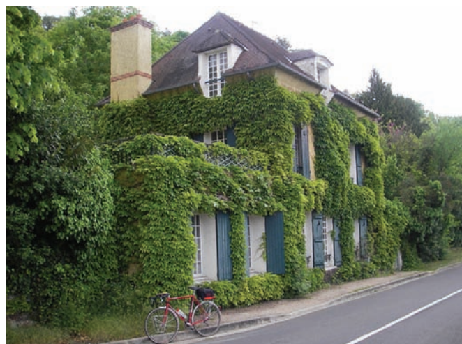
Рис. 5. Вертикальное озеленение