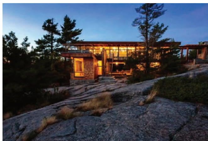
Рис. 6. Загородный дом в североамериканских горах, построенный преимущественно из пихты. Архитектор Чарльз Гейн