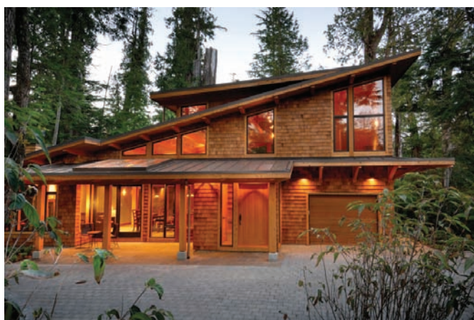
Рис. 1. Пример применения деревянного кирпича

Keywords: sustainable architecture, natural materials, ecology, energy efficiency, favorable environment