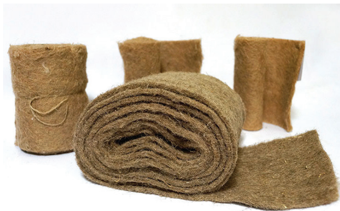
Рис. 3. Льняной утеплитель (источник: http://rosecomat.ru/d/1229712/d/mejvencoviy__rosecomat.jpg )

Среди совершенно новых инновационных разработок натуральных материалов можно привести пеностекло, обладающее особой прочностью, сравнимой с прочностью кирпича. Интересен применяемый в «зелёной» архитектуре альтернативный бетон из песка пустыни. По сравнению с речным, такой песок слишком гладкий и мелкий и не может быть использован в бетоне в чистом виде, но благодаря инновационной технологии новый состав из песка пустыни не