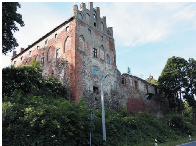
Рис. 1. Замок в Маёвке (бывший Георгенбург). 1351 год. 2017 год

Первые этажи и фундаменты крепостей на завоёванной территории прусских племён первоначально выкладывались исключительно из валунов, что можно наблюдать в частично сохранившихся замках XIV века в бывшем Тапиау (совр. Гвардейск), в бывшем замке самбийских епископов Георгенсбурге (совр. Маёвка вблизи Черняховска) и других (рис. 1). В Рагните замок был полностью возведён на новом месте в 1397–1409 годах под руководством мастера Николауса Фелленштайна из Мариенбурга (совр. Мальборк, Польша). В Тапиау при перестройке первоначального укрепления в 1347–1359 годах построили новый четырёхфлигельный замок в соответствии с общепринятым в Ордене священным библейским образцом (рис. 2). «До высоты главного второго этажа стены были сложены из полевого камня, выше – из обожжённого кирпича. Толщина стен была более трёх метров» [6, с. 465].