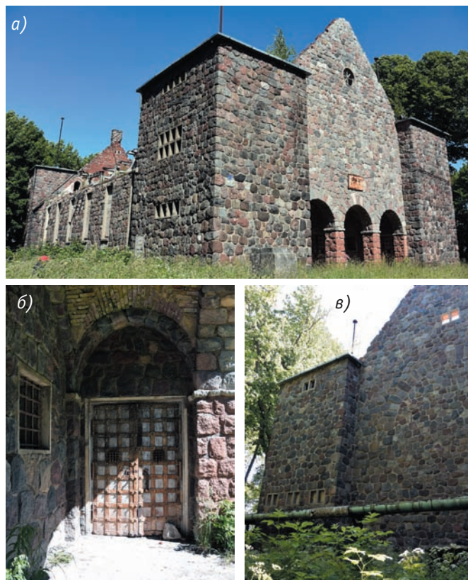
Рис. 7. Так называемый «партайбург». Город Неман (бывший Рагнит). Архитектор и точная дата строительства не выявлены (до 1933 года). 2017 год