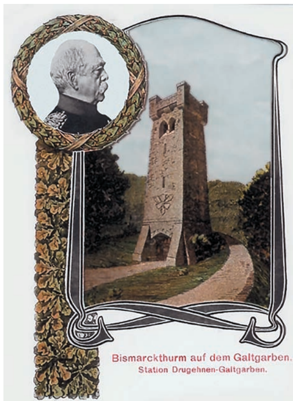
Рис. 6. Башня Бисмарка в Гальтгарбене (без совр. названия)