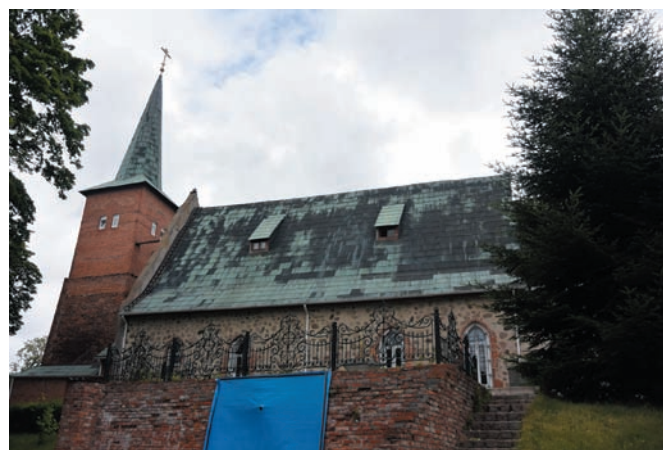
Рис. 3. Храм в Менделеево (бывш. Юдиттен). 2017 год