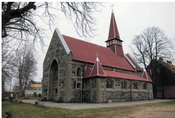
Рис. 4. Храм в посёлке Янтарный (бывш. Пальмникен). 1887–1892 годы. Архитектор не выявлен. 2011 год

Балтийского моря появляется ряд «валунных» храмов, среди которых выделяется церковь в Пальмникене (совр. пос. Янтарный Калининградской области), освящённая в 1996 году во имя иконы Казанской Божией матери. Здание из гранитных валунов с подчёркнутыми светлым раствором швами возведено в 1887–1892 годы по заказу владельца крупнейшей местной янтарной мануфактуры Морица Беккера (1830–1901) для 2000 работников его предприятия [9, s. 133–134] (рис. 4). За образец была взята капелла Святого Георгия в парке дворца Монбизу в Берлине [11, s. 24], построенная из силезского песчаника и валунных блоков по проекту архитектора Юлиуса Карла Рашдорффа. Она предназначалась для проведения англиканских богослужений (освящена в ноябре 1885 года). Мастер специально был направлен в Англию для ознакомления с местными традициями храмостроения. Капелла строилась на средства англиканской общины Берлина и под особым покровительством принцессы Виктории Английской и Ирландской (1840–1901), дочери английской королевы Виктории и супруги кронпринца Фридриха (1831–1888). Кронпринц считался одним из самых многообещающих престолонаследников Европы, но взшёл на престол, будучи уже смертельно больным, как кайзер Фридрих III и царствовал всего 99 дней (1888). Капеллу посещали во время визитов в Германию английская королева Виктория (1888), короли Эдуард II и Георг V (1913).