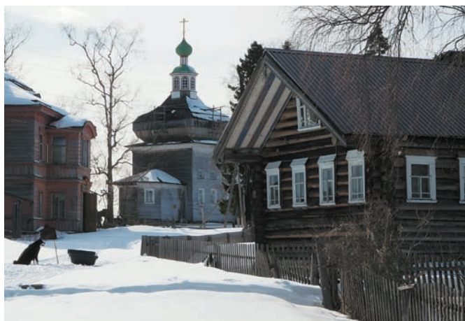
Рис. 2. Церковь во имя Богоявления Господня в деревне Поле. 1852–1853 годы. 2019 год