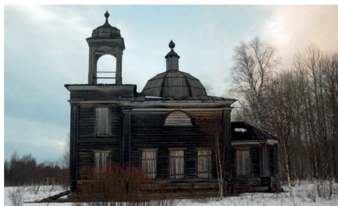
Рис. 8. Церковь свв. Кирика и Улиты в деревне Давыдовская (Канзапельда). 1844 год. 2019 год