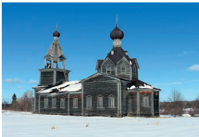
Рис. 4. Троицкая церковь в селе Мондино. 1877–1888 годы. 2019 год

После пожара перед крестьянами Мондинского прихода остро встал вопрос о сооружении нового храма вместо двух утраченных 15 . К следующей зиме крестьяне перенесли в Мондино из соседней деревни часовню и преобразовали её в церковь, которая и была освящена 12 ноября 1877 года в честь Благовещения 16 . Однако это сооружение, внутри которого были устроены престол и иконостас (даже без обычной пристройки алтаря), могло использоваться только как временная церковь. Поэтому одновременно шла работа над проектом нового храма. Прихожане намеревались «1. Вместо сгоревших двух деревянных церквей и колокольни... выстроить одну новую деревянную церковь с таковою же над папертью колокольней, на том же самом гористом месте, как более удобном и приличном, где грунт земли песчаный и крепок... 2. В церкви предполагается устроить один престол