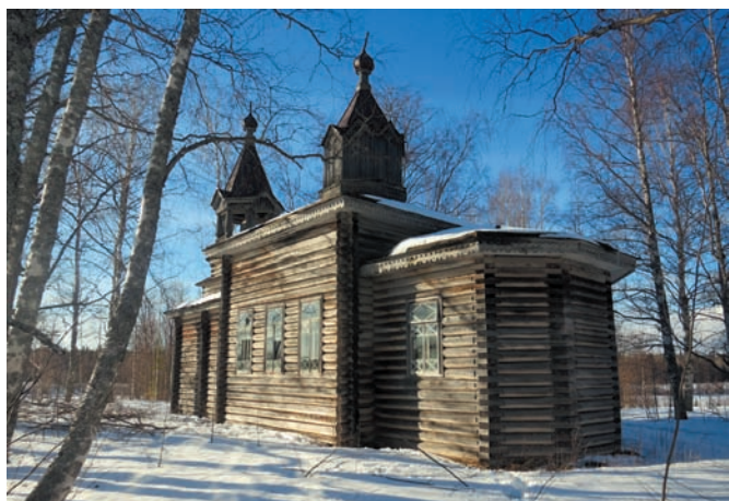
Рис. 6. Церковь св. Ильи Пророка в деревне Каменное. 1911–1914 годы. 2019 год

пользовавшаяся не так долго и поэтому почти не подвергшаяся износу, интересна и тем, что на протяжении всего бурного и драматичного XX столетия она сохранила в себе множество деталей внутреннего убранства – иконостас, клиросы, печи, оконные переплёты с характерным узором расстекловки, граффити, плотничьи знаки, ковку, церковную утварь, священническое облачение и даже вешалки для верхней одежды прихожан, что позволяет глубоко погрузиться в повседневность церковной жизни дореволюционной России.