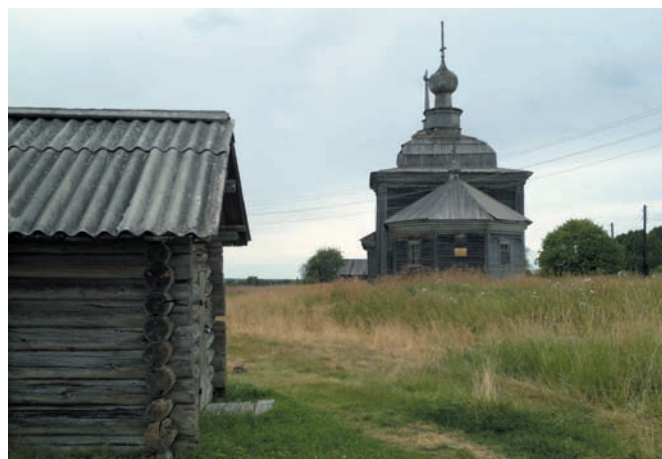
Рис. 3. Никольская церковь в деревне Сырья. 1867–1875 годы. Фото А.Б. Бодэ. 2018 год