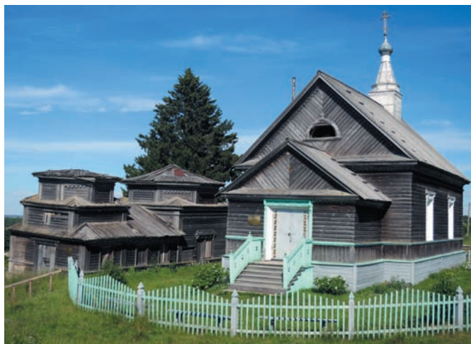
Рис. 1. Церковь св. Илии Пророка в селе Большой Бор. 1855 год. Фото Е.В. Ходаковского. 2018 год

Церковь св. Илии Пророка в деревне Большой Бор (1855) Чекуевского прихода Онежского уезда (рис. 1) стала одной из первых, возведённых в рамках этой синодальной программы,