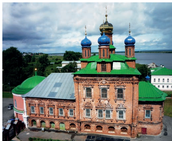
Рис. 3. Вид на Спасо-Преображенский собор с колокольни. 2015 год

Чердынь является самым старинным городом на территории Верхнекамья. Первоначально вся городская застройка была исключительно деревянной, однако город неоднократно страдал от крупных пожаров, и культовые постройки первыми начали возводить из кирпича. Город обрёл регулярную планировку только после указа Екатерины II 1763 года, тогда на существующую уличную сеть была наложена геометрически чёткая сетка улиц. На территории города сохранилось 12 памятников культового зодчества, к рассматриваемому периоду относятся пять сооружений: Успенская церковь, Церковь Иоанна Богослова в Иоанно-Богословском мона-