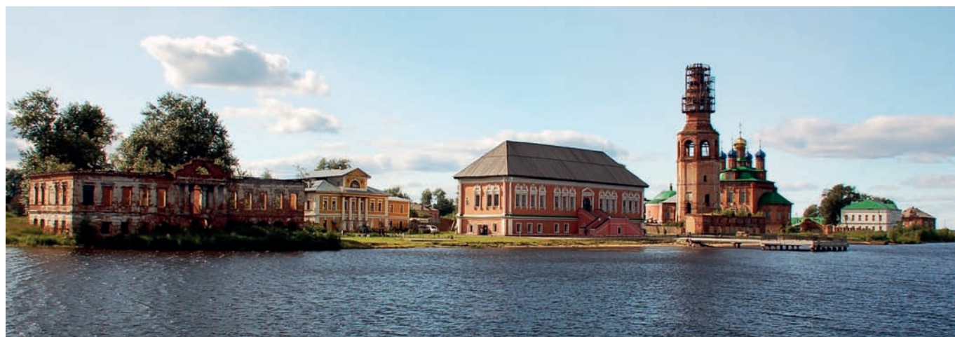
Рис. 2. Вид с реки на Усольский историко-архитектурный комплекс. 2015 год