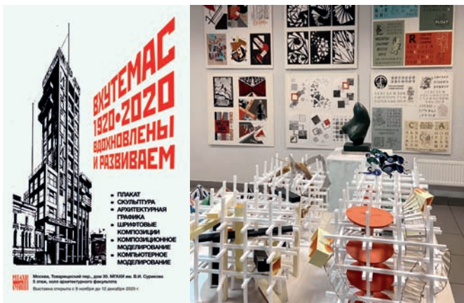
Рис. 4. Выставка «ВХУТЕМАС. 1920–2020. Вдохновлены и развиваем». МГАХИ им. В.И. Сурикова: а) афиша выставки; б) фрагмент экспозиции