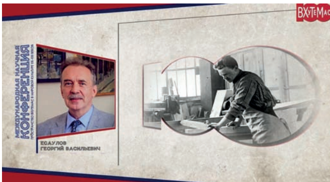
Рис. 4. Обращение от научного комитета (видео-доклад) сопредседателя научного комитета конференции академика Г.В. Есаулова

В Музее экслибриса и миниатюрной книги представлена экспозиция под названием «Традиции и новаторство. 100-летию ВХУТЕМАСа посвящается». Выставка организована кафедрой «Рисунок и живопись» Высшей школы печати и медиаиндустрии Московского политехнического университета при поддержке Международного союза книголюбов.