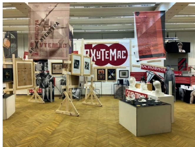
Рис. 3. Выставка «ВХУТЕМАС в МАРХИ»