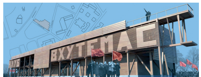
Рис. 9. Проект клуба-музея ВХУТЕМАС. Автор К.Д. Шаповалов

Важную роль играют выставки, проводимые вузами – наследниками Высших художественно-технических мастерских. Здесь позиция кураторов направлена на выявление преемственности и последовательное продолжение традиций ВХУТЕМАСа. Зачастую экспрессивные, эпатажные формы