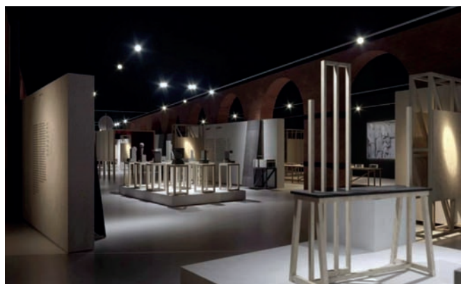
Рис. 2. Выставка «ВХУТЕМАС 100. Школа авангарда» в Музее Москвы

В Московском архитектурном институте при поддержке Департамента культурного наследия города Москвы от-