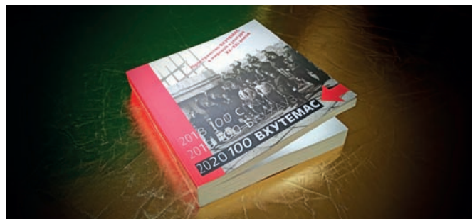
Рис. 6. Пространство ВХУТЕМАС в мировой культуре XX–XXI веков: коллективная научная монография (М. : МАРХИ, МГПА им. С.Г. Строганова, РАХ, Московский политехнический университет, 2020. – 612 с.)

Так, в двухтомнике «ВХУТЕМАС–ВХУТЕИН. Полиграфический факультет. 1920–1930» представлен обширный материал о преподавателях и студентах ВХУТЕМАСа с подробной биографией художников, учившихся на Полиграфическом