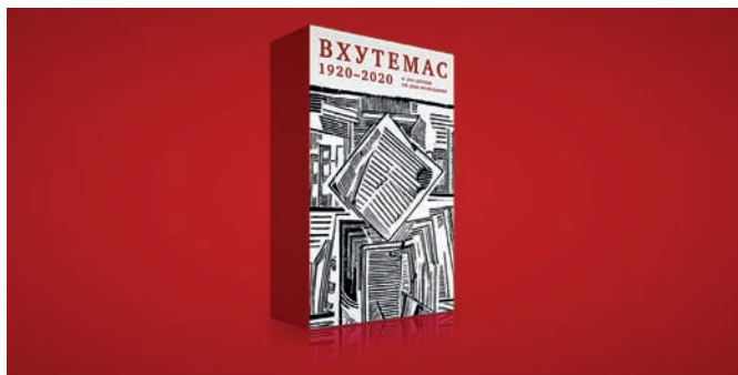
Рис. 7. ВХУТЕМАС–ВХУТЕИН. Полиграфический факультет. 1920–1930 : В 2 т. / авт.-сост. Л.И. Черток (М. : Бослен, 2020. – 1360 с.)