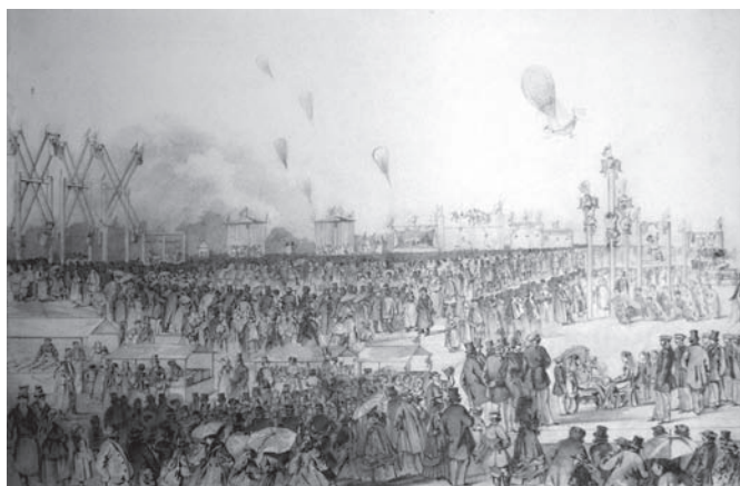
Рис. 1. Народный праздник 20 июля 1869 года в Ильинском. Литография