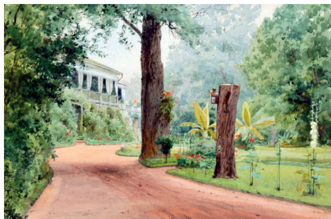
Рис. 2. Альб. Н. Бенуа. Дворец и парк Ильинского. Акварель.