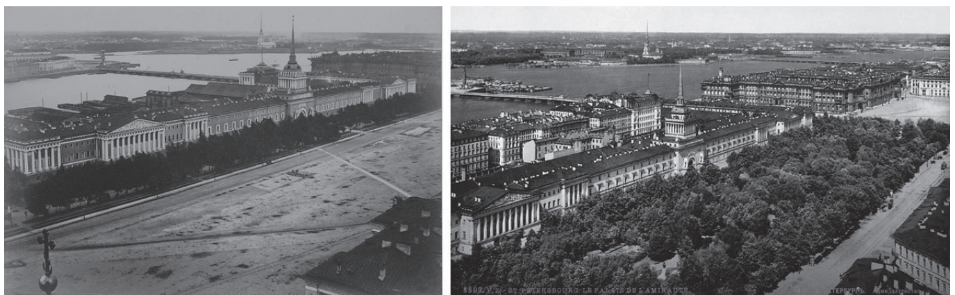
Рис. 2. Изменение пространства Адмиралтейской площади: слева – 1860-е годы (источник: Лоренс. Панорама-Санкт-Петербурга. Лист 54 из-альбома «Виды Санкт-Петербурга. 1860-е». Альбуминовый отпечаток), справа – 1890-е [источник: Санкт-Петербург. Архитектура: Адмиралтейство ( gorod-sankt.blogspot.com )]