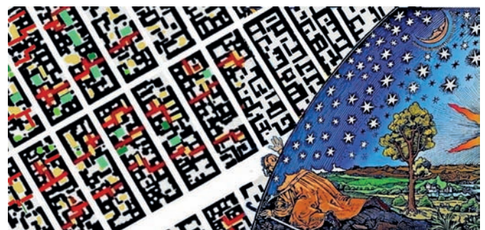
Рис. 4. «Terra incognita» внутриквартальной среды Санкт-Петербурга. Схемы авторов статьи (с использованием фрагмента «гравюры Фламариона»)