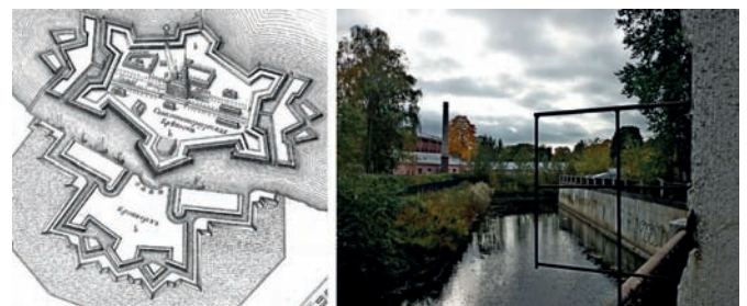
Рис. 3. Кронверк Петропавловской крепости: слева – схема плана середины XVIII века (фрагмент «плана Махаева»), справа – современная фотография. 2006 год

В кварталах исторического центра, которые в Санкт-Петербурге охватывают 2114 га [23] на протяжении столетий спонтанно сформировались многообразные типы городской