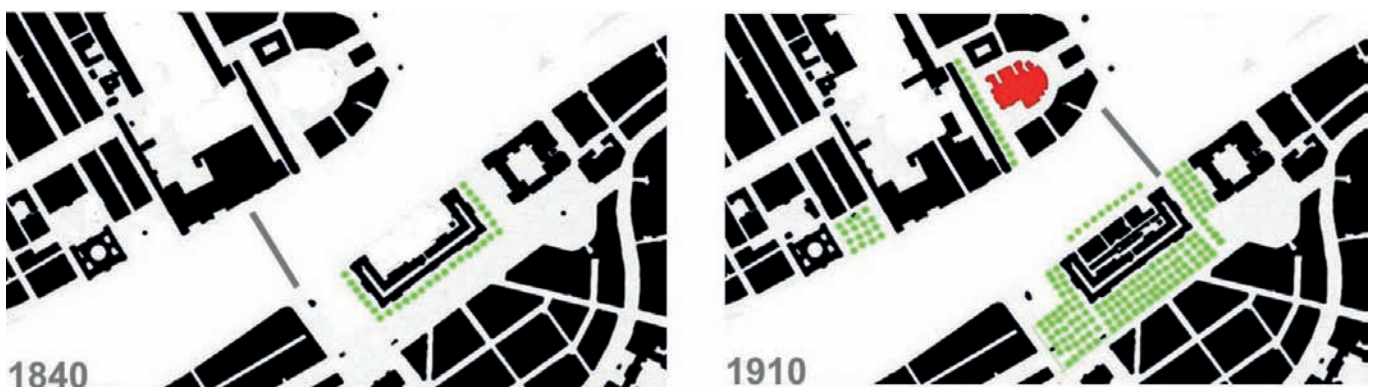
Рис. 1. Эволюция открытых пространств исторического центра Санкт-Петербурга. Схемы авторов статьи

Сомнительна ссылка на «Серебряный век» русской культуры – виднейшие специалисты-искусствоведы той поры резко критиковали деградацию ландшафтов центра, называя происходившее «градостроительным варварством» [1; 11–14]. В.Я. Курбатов писал: «Весь фасад Адмиралтейства закрыт рощами плохо спланированного Александровского сада» [15]. Игнорируется мнение одного из основоположников отечественного градостроительства В.Н. Семёнова: «Многие городские ансамбли испорчены зеленью. Последней дают разрастаться, закрывать архитектуру, уничтожать целостность впечатления... Примеры: центр Ленинграда, где Александровский сад уничтожает центральный ансамбль» [16] 1 .