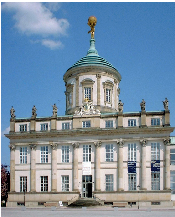
Рис. 4. Старая Ратуша. Потсдам. Архитектор Я. Боуман. 1753–1755