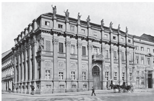
Рис. 2. Фасад дворца И. К. Плезера. Архитектор К. Л. Хильдебрандт. 1753 год