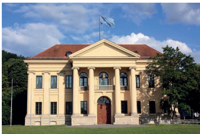
Рис. 6. Дворец принца Карла в Английском парке. Мюнхен, Германия. Архитектор К. фон Фишер. 1804–1809 годы

сдержанный характер стиля «цопф», хотя хронологически выходит за границы обоих явлений в немецком зодчестве [15]. Спроектирован небольшой дворец, фактически вилла, архитектором К. фон Фишером (1782–1820) для аббата Пьера де Салаберта 13 . К. фон Фишер полностью отрицал новые модные в то время веяния романтизма и историзма, поэтому проект дворца принца Карла стал своеобразным ультимативным манифестом архитектора в защиту чистоты палладианского стиля [16, S. 24].