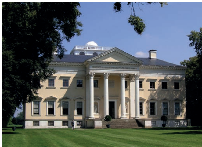
Рис. 1. Дворец Верлиц в Дессау. Архитектор Ф.В. Эрдманнсдорф. 1769–1773 годы 2