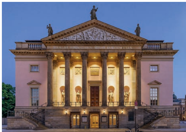
Рис. 3. Опера в Берлине. Архитектор Г.В. фон Кнобельсдорф. 1740–1743 годы