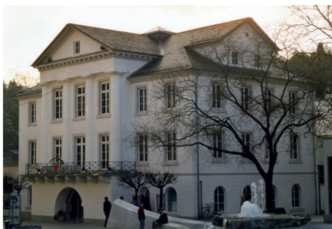
Рис. 8. Вилла Гамильтон в Баден-Бадене. Архитектор И.Я.Ф. Вайнбрэннер. 1809 год