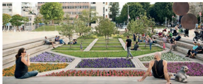
Рис. 2. Израиль. Общественные пространства. Тель-Авив-Яффо, Израиль

Необходимо учитывать, что разработка стратегических планов крупных городов, агломераций является прогрессивным мировым трендом, и, соответственно, должна состояться и в России. Уже сейчас многие элементы такого планирования могут быть использованы в отечественном стратегическом планировании.