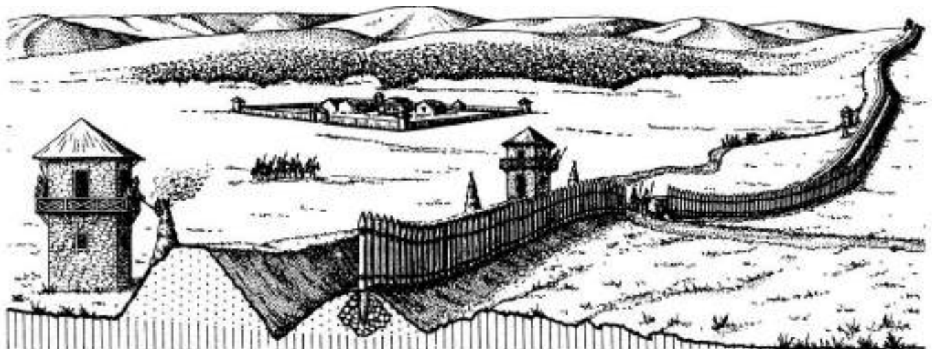
Рис. 3. Лимес – система укреплений и коммуникаций на границе Римской Империи