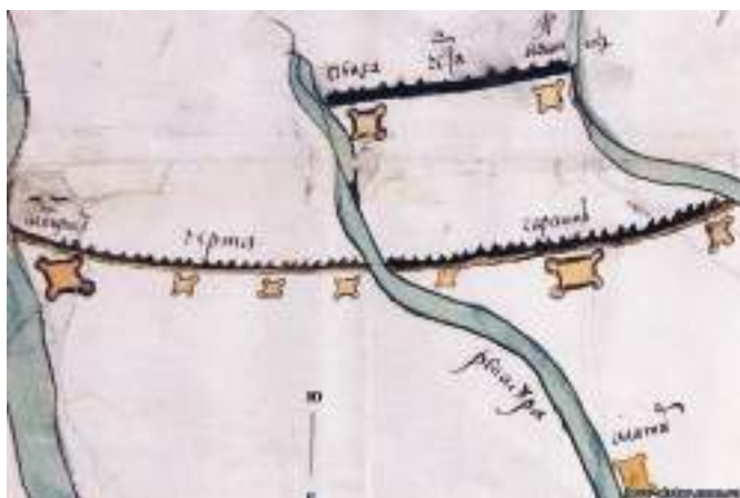
Рис. 2. Пример расположения городов, городков и острогов на сторожевой линии

Как утверждает Ф. Ласковский, оборонительная система России «до Императора Петра, охранялась... отдельными укреплёнными пунктами, – и сторожевыми линиями» [3, с. 9]. При этом он отмечает, что укреплённые пункты были известны и упоминались в летописях и иных официальных актах как города, городки, остроги и сторожки. Но если о времени строительства оборонительных сооружений вокруг населённых пунктов не возникает вопросов, то иное дело «сторожевые линии», которые, по мнению того же Ф. Ласковского, «...могли образоваться только по введению в России единодержавия»,