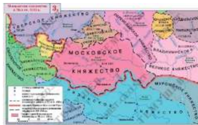
Рис. 1. Земли Московского княжества во второй половине XIII века

«Сторожевые линии», начало формирования которых относят к XIV веку [1, с. 1], изучались и изучаются в основном как оборонительные системы, создаваемые на протяжении большого периода времени для защиты населения и государства. Это работы Д. Багаля, Зориан Доленги-Ходаковского (Адам Чарноцкий), Ф. Ласковского, И.Д. Беляева,