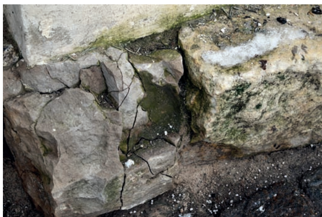
Рис. 5. Фрагмент разрушающейся каменной кладки в основании стены. Февраль 2022 года