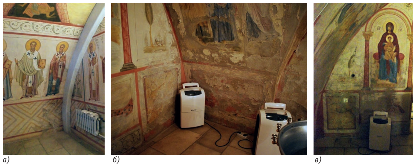
Рис. 4. Биокоррозия фресок: а) в алтарной части баптистерия; б) на стене слева от алтаря. Видны два осушителя воздуха; в) на стене слева от входа в алтарную часть. Виден осушитель воздуха. Февраль 2022 года