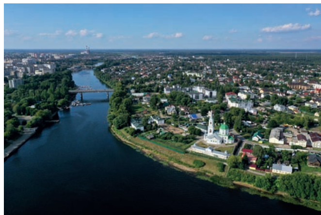
Рис. 2. Тверь. Территория Екатерининского монастыря в Затверечье на мысу в устье реки Тверцы. Вид с юго-востока. Август 2022 года