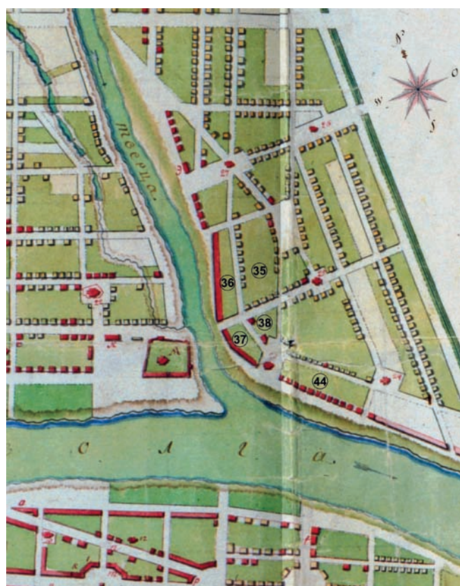
Рис. 4. Фрагмент плана Твери 1797 года. Указаны современные номера кварталов в мысовой части Затверечья (источник: РГВИА. Ф. 846. Оп. 16. Д. 22644)