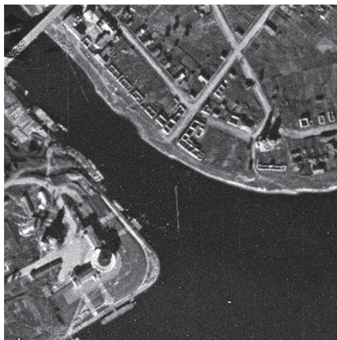
Рис. 9. Мысовая часть Затверечья на немецкой аэрофото съёмке 1942–1943 годов.