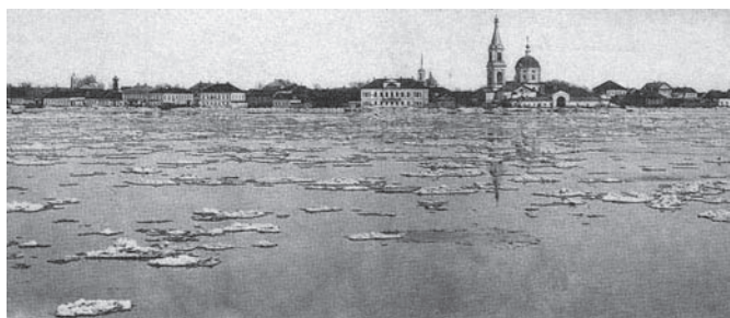
Рис. 8. Мысовой «фасад» Затверечья в начале XX века. Вид из центральной части Твери.