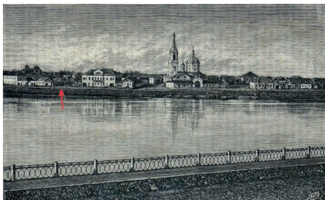
Рис. 7. Затверечье. Церковь Екатерины Мученицы и застройка (слева) 37-го квартала, где фиксируется пустырь (указан стрелкой) на месте одного из домов последней четверти XVIII века

отдельных элементов) были, по всей видимости, и у северной, ныне руинированной половины дома № 32, который изначально, как и подавляющее большинство упомянутых выше каменных построек береговой зоны Затверечья, состоял из двух «полудомов». Полагаем, что типологически близкий декор мог украшать и фасады каменных построек последней четверти XVIII – начала XIX века на территории современного Екатерининского монастыря. Тем более что позднебарочное убранство присутствует сегодня на фасадах отдельных сооружений обители. Более отчётливо – у дома № 24 по улице