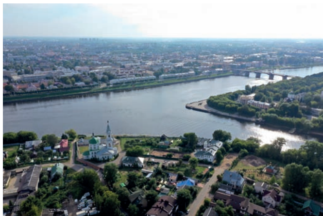
Рис. 1. Тверь. Место впадения реки Тверцы в Волгу. Вид с юга. Август 2022 года

Ещё не так давно украшением устья Тверцы были расположенные на её берегах здание Речного вокзала и церковь Екатерины. Но в силу того, что сегодня Речной вокзал – это руинированное сооружение, основным архитектурным достоинством этого очень важного в градостроительном отношении места в центральной части города стал Екатерининский монастырь (рис. 2).