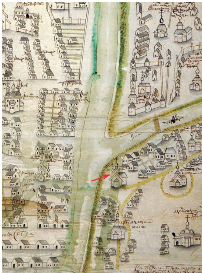
Рис. 3. Екатерининский храм в Затверечье на рисованном плане Твери первой четверти XVIII века

Чудовищное по своим масштабам лихолетье перечеркнуло достигнутые в течение XVI столетия успехи в деле развития