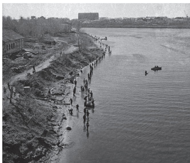
Рис. 10. Калинин (Тверь). Южная часть 36-го квартала в Затверечье после разборки каменных домов. Вид с севера (с моста им. П.Ф. Богомолова). Середина – вторая половина XX века