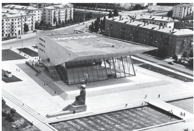
Рис. 3. Здание кинотеатра «Аврора». Краснодар. Архитектор Е.А. Сердюков. 1962–1967 годы. Фото 1968 года [источник: Государственный музей истории Санкт-Петербурга. Номер по КП (ГИК): ГМИ СПб 363380/138 // ГОСКАТАЛОГ.РФ (URL: https://goskatalog.ru/portal/#/collections?id=26045454 )]

глухой закрытый объём зрительных залов, продолжающийся в виде консольно выступающего козырька, как бы парит над остеклённой частью фасадов. Ограждённые витражами пространства фойе и кафе объединены со стилобатной частью здания и благоустроенной прилегающей территорией, включающей малые архитектурные формы (плоский бассейн) и тематическую скульптуру «Аврора» (1967, скульптор И.П. Шмагун, архитектор Е.Г. Лашук 14 ) (рис 3). Упрощённый вариант объёма здания кинотеатра, утверждённый в качестве типового проекта, был многократно воспроизведён в архитектуре южнороссийского региона: кинотеатры «Юбилейный» и «Сокол» в Ростове-на-Дону.