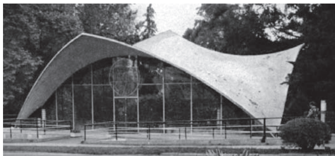
Рис. 2. Цветочный павильон. Сочи. Архитектор Г. Черноус, инженер Г. Вакуленко. 1971 год. Фото 1983 года (источник: [13, с. 24])