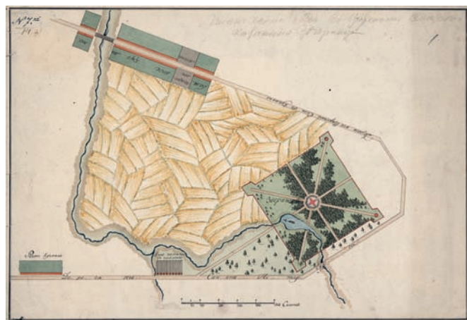
Рис. 1. Царское Село. План зверинца и примыкающих к нему участков. Начало XIX века. Бумага; тушь, акварель

Однако в русском архитектурном «ландшафте» обнаруживаются довольно близкие аналоги «Зверинца». Ещё одна рокайльная «крепость» – хотя и не столь грандиозная – с изящными беседками, увенчанными куполами, «прикрывала» с воды дачу фрейлины Елизаветы Петровны графини А.И. Бестужевой-Рюминой. Этот блестящий барочный ансамбль на Каменном острове известен благодаря серии видов, выполненных М.И. Махаевым в 1756 году: на гравюре запечатлено сооружение, которое выгораживало прибрежный участок Малой Невки (рис. 2). Был ли таким образом оформлен уса-