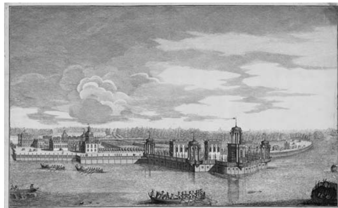
Рис. 2. Неизвестный гравёр, по рисунку М.И. Махаева Вид галереи и решетки в саду гр. Бестужевой-Рюминой на Каменном острове ... 1750-е годы. Бумага; офорт, резец (источник: ГЭ, инв. № ЭРГ-20188. © Государственный эрмитаж, Санкт-Петербург)