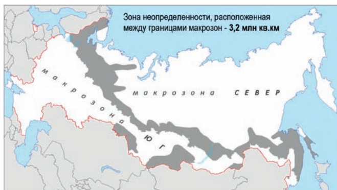
Рис. 2. Зона неопределённости между макростоном России. Выделена В.А. Григорьевым