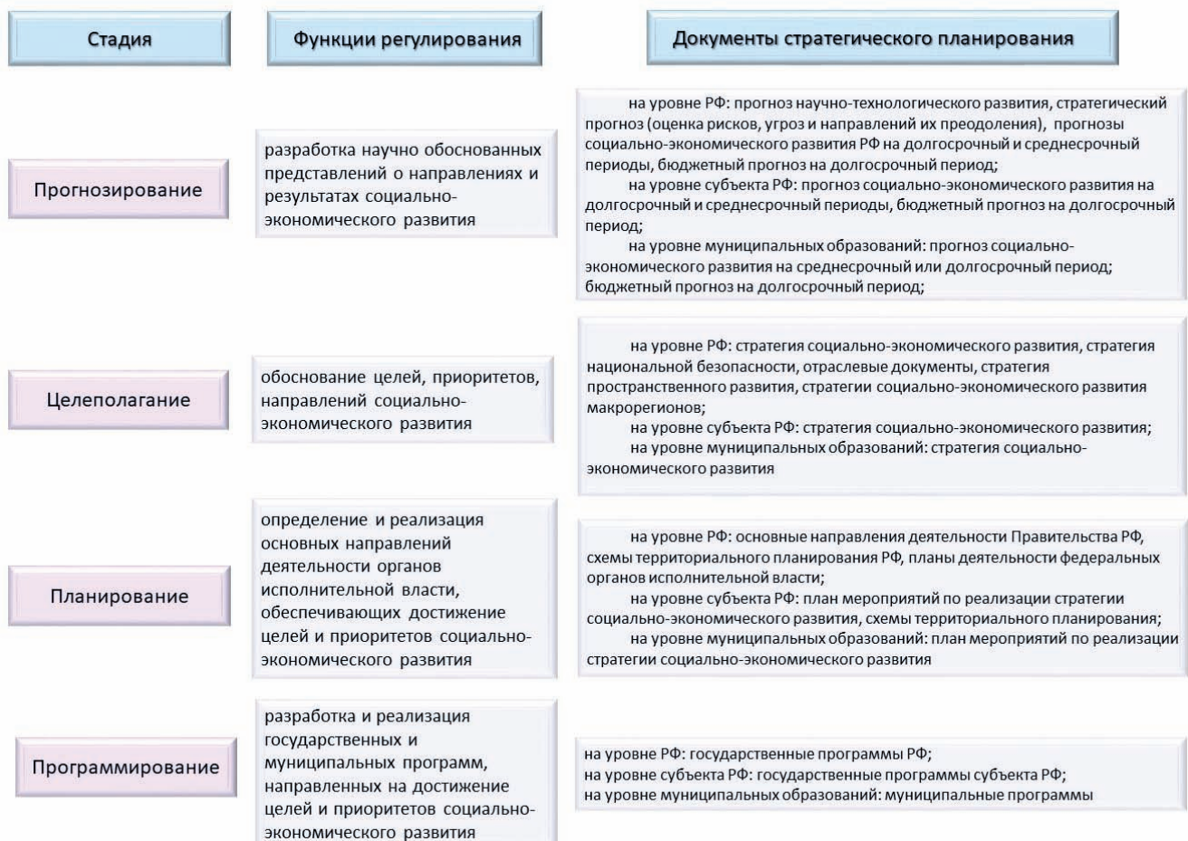
Рис. 2. Состав и документы цикла стратегического планирования. Схема автора статьи