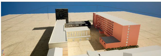
Рис. 2. Модели кампуса после расстановки внутри игрового движка