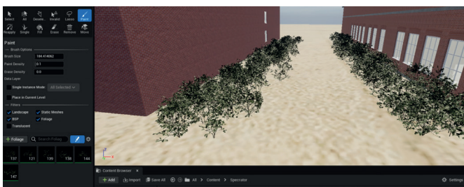
Рис. 4. Размещение растительности

8. Базилевич, М.Е. Игровой движок Unreal Engine: визуализация и «разрушаемая» архитектура / М.Е. Базилевич, О.А. Борисова, Е.В. Мазур. – Текст : непосредственный // Дальний Восток: проблемы развития архитектурно-строительного комплекса. – 2019. – № 1–2. – С. 17–20.