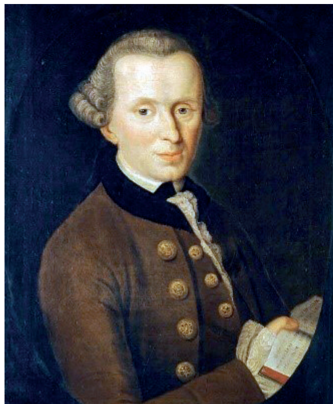
Рис. 1. И.Г. Беккер. Портрет И. Канта. 1768 год. Иллюстрация из открытого доступа сети Интернет