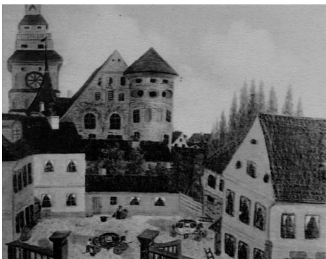
Рис. 6. Неизвестный автор. Вид Юнкерштрассе. Кёнигсберг. 1832 год. Гравюра (источник: [10])