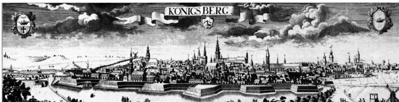
Рис. 2. Фридрих Бернхард Вернер. Кёнигсберг. Вид с южной стороны. Гравюра. 1729 год.

Начиная с XVI века, особой достопримечательностью улицы был располагавшийся над ней крытый деревянный мостик («Клаффлаубе», или «висячая беседка»), проходящий от восточной части северного флигеля замка (точнее, от башни при Корнхаузе) высоко над зданием тюрьмы, через ров к герцогским садам и крытому спортивному залу для игры в мяч. В герцогское и курфюрстское время в специально построенном крытом помещении играли в подобие современного большого тенниса [6, S. 194–196]. Зал был разобран в конце XVIII века,