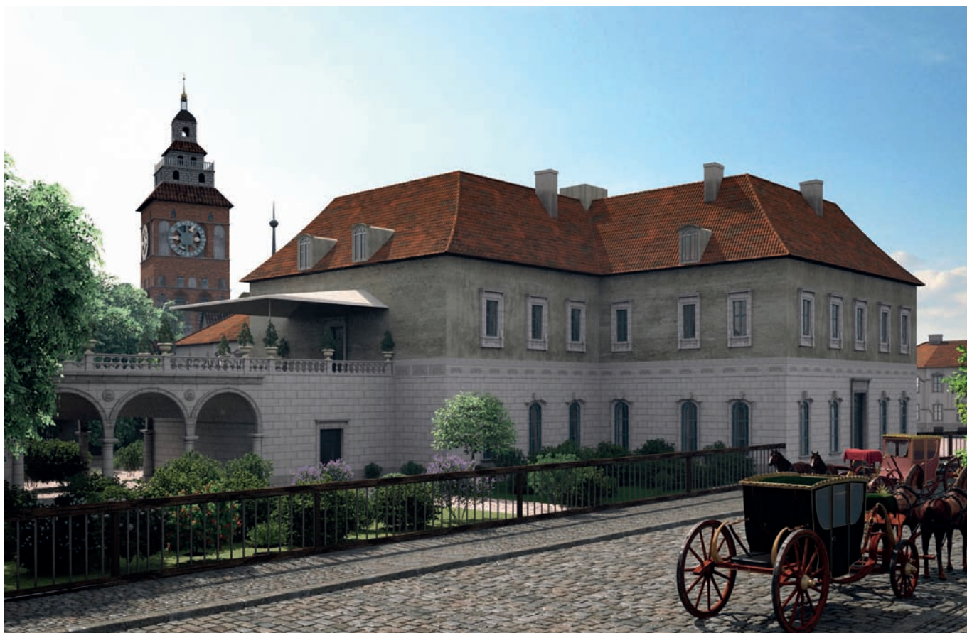
Рис. 7. Дом книготорговца Ф. Николовиуса на Юнкерштрассе в Кёнигсберге. 2023 год. Автор трёхмерной реконструкции В.А. Верещагин