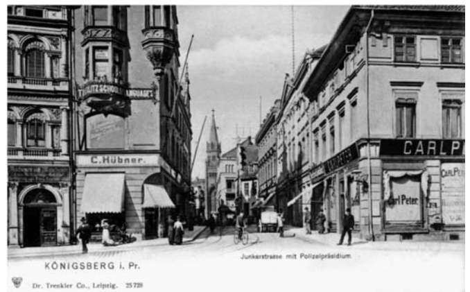
Рис. 3. Кёнигсберг. Юнкерштрассе. Начало XX века. Открытка (источник: [8, S. 77])

Очередная перестройка была осуществлена в период владения домом герцогом Фридрихом Карлом Людвигом фон Шлезвиг-Гольштейн-Зондербург-Бекским (1757–1816), заключившим в Кёнигсберге в 1780 году брак с графиней Фридерикой Амалией фон Шлибен (1757–1827) и, вероятно, около этого времени поселившимся на Юнкерштрассе. В чём