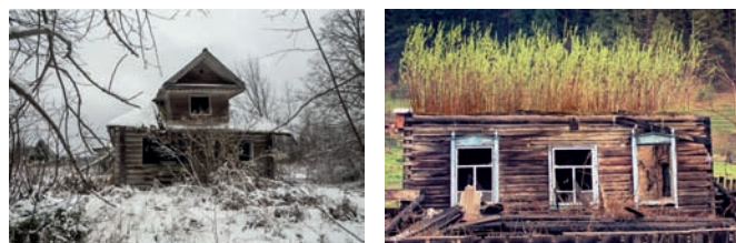
Рис. 2. Заброшенные дома

Строительство вылетных транспортных магистралей не всегда способствует сохранению сельских поселений. Напри-