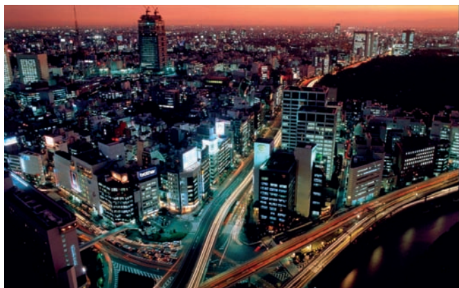
Рис. 1. Токио

В настоящее время в мире наблюдается самая большая волна урбанизации, о чём свидетельствует тот факт, что более миллиона человек переезжают в города каждую неделю по