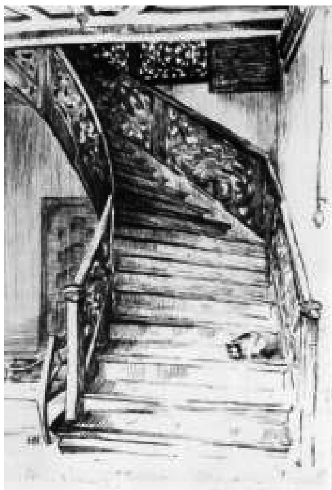
Рис. 5. Х. Нойманн. Аптека Хагена. Лестница в фойе. Около 1910 года. Офорт (источник: [12])

тории – «Laboratorium pharmacopolii aulici regionontani», размещавшейся в подвале аптеки, в двух вариантах, которые были помещены на обложках учебника по фармации первого [8] и второго [14] издания. На гравюре, датируемой 1778 годом, помещение аптеки с подробно прорисованными приборами и устройствами, взято в декоративную раму в форме рокайльного картуша (рис. 6 а). Второй вариант из книги 1781 года, повторяющий тот же интерьер, лишён декоративного обрамления, отвлекающего внимание читателя, и более нагляден (рис. 6 б). Изображение подвала-лаборатории подробно прокомментировал Х.М. Мюльпфордт: «Мы видим на офорте большое сводчатое подвальное помещение с плиточным полом. Перед двумя большими решётчатыми окнами на кирпичной плите стоят огромные котёл и дистиллировочная колба. У стен расположены другие кирпичные плиты с ретортами и большим горшкоподобным охлаждающим сосудом. На правой стене висит доска, на которой укреплены ковши, сито и четырёхугольный деревянный пюпитр с прижимной рамкой, которая накрывалась тканью