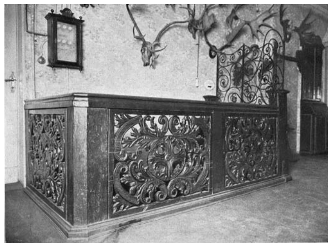
Рис. 4. Аптека Хагена. 1654 год. Резное ограждение лестницы на верхнем этаже. Фото начала XX века (источник: [3, S. 15])