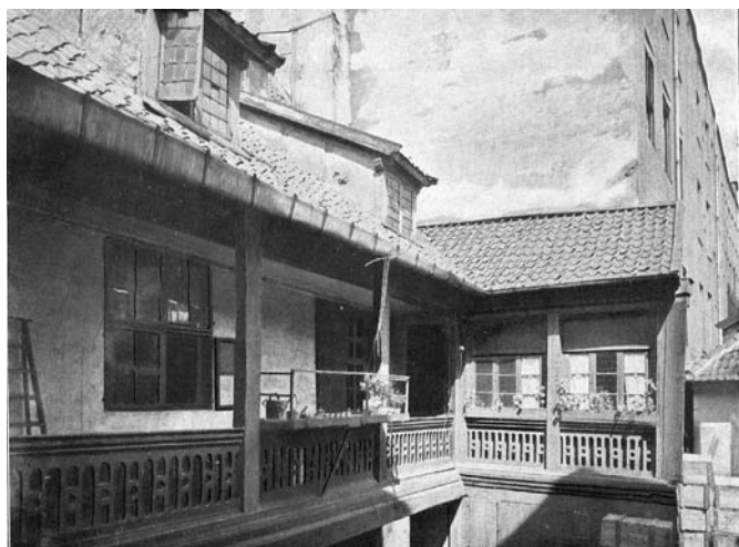
Рис. 3. Кёнигсберг. Аптека Хагена. 1654 год. Галерея внутреннего двора. Фото начала XX века