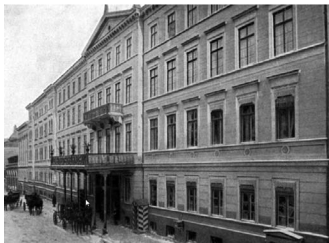
Рис. 9. Отель «Немецкий дом». Конец XIX – начало XX века