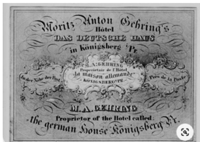
Рис. 7. Кёнигсберг. Визитная карточка отеля «Немецкий дом» на Театерштрассе.

Высокие восьмичастные окна второго этажа украшены сверху полуциркульными и треугольными сандриками. К центральному ризалиту примыкали боковые флигели на три оси с характерными для XVIII столетия вертикальными окнами с замковыми камнями и плоскими наличниками. Стены дома были облицованы подобием каменных квадратов: вероятнее всего, это была штукатурная имитация. С правой стороны к дому примыкала аптека Хагена, с левой виден протяжённый флигель, высотой равный основному зданию