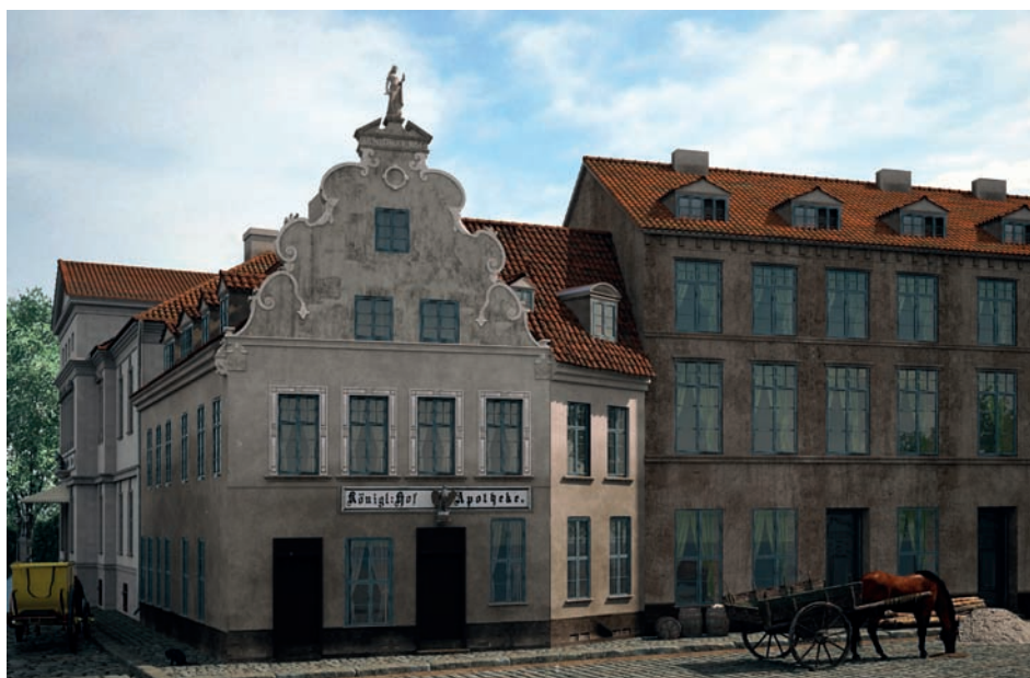
а) б) Рис. 1. Кёнигсберг. Аптека Хагена. 1654 год: а) общий вид (источник: [3, с. 15]); б) трёхмерная реконструкция. Автор В.А. Верещагин. 2023 год