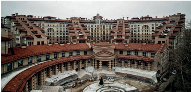
Рис. 5. «Итальянский квартал». Архитектор М. Филиппов. Москва. 2013 год.

соседние стилевые явления, а ясность классицизма Золотого века осталась в прошлом. Российский неоклассицизм XXI века стал прямым продолжением архитектуры Серебряного века и сталинской неоклассики, он развивался в контрапункте с ар-деко и даже отдельными приёмами модернизма; он имеет некоторые пересечения с зарубежной традиционной архитектурой и в свою очередь влияет на неё; он опирается и на опыт Ренессанса и античности (общие истоки для всех проявлений неоклассицизма). В этом смысле невозможно говорить о единой стройной системе стиля: третья волна неоклассицизма столь же поливариантна, как первая и вторая. Неоклассицизм Серебряного века, как известно, переключался с северным модерном, эклектикой, стилизовал Ренессанс и русский ампир. Неоклассицизм 1930–1950-х годов включил в свою орбиту некоторые приёмы и стилистику конструктивизма и ар-деко, нарышкинского барокко, русского стиля, палладианства и итальянского кватроченто.