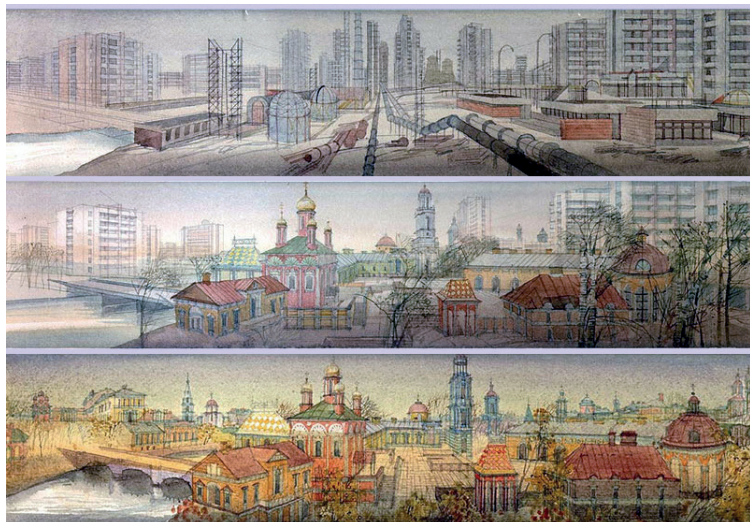
Рис. 1. Конкурсный проект «Стиль 2001 года». 1984. Архитектор и фото акварелей М. Филиппов

спровоцированный постмодернистской концепцией смерти автора). И на новом витке спирали произошло возвращение к традиции. В отечественном искусстве оно случилось в таком выдающемся явлении, как бумажная архитектура.