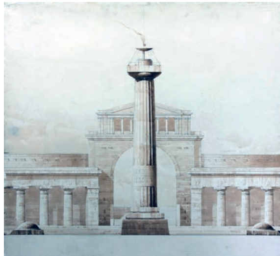
Рис. 2. Музей военно-морского флота в Кронштадте. Дипломный проект. Архитектор М. Атаянц. 1995 год. Иллюстрация предоставлена автором проекта