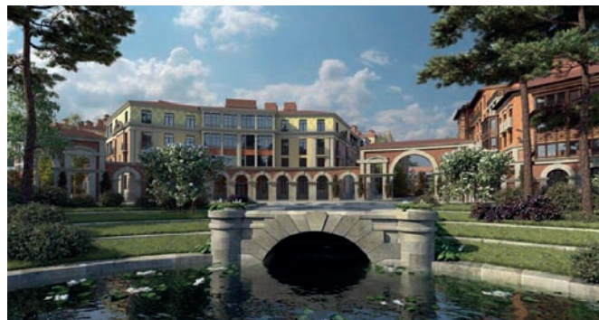
Рис. 4. Город Лесобережный. Архитектор М. Атаянц. Московская область. 2024 год.

При попытке определить формальную концепцию неоклассицизма XXI века в России, исследователь сталкивается с известной трудностью. Понятно, что в орбиту стиля входили и