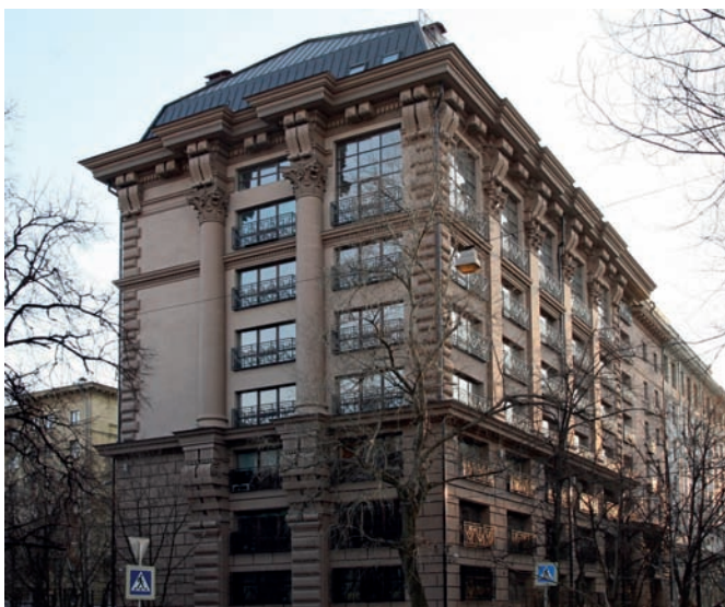
Рис. 10. Жилой дом «Manhattan House». Архитекторы Д. Бархин и А. Бархин. Москва. 2012 год.