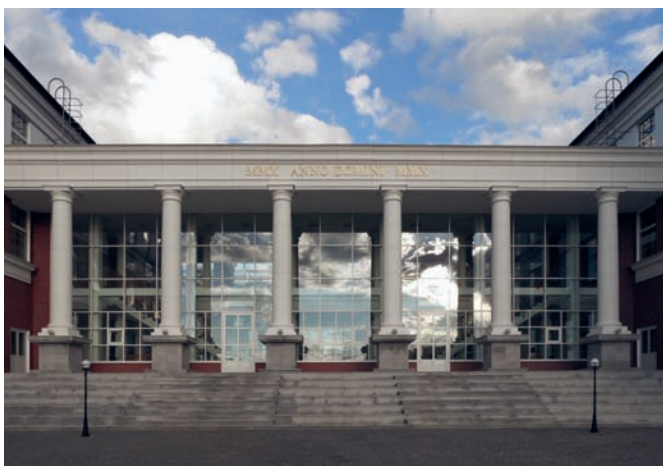
Рис. 11. Школа «Президент». Архитектор М. Белов. Деревня Жуковка, Московская область. 2010 год.

Пространственная полуротонда, украшающая угол в квартале «Ренессанс», – дань торцевым ордерным композициям ленинградского ар-деко Фомина-Левинсона на Ивановской улице. Героическая пролетарская классика И.А. Фомина с упрощёнными дорическими колоннами получает неожиданную лирическую интерпретацию в камерной деревянной постройке школы-мастерской Артёма Никифорова (рис. 9). Банк на Новинском бульваре Дмитрия Бархина переносит в другую типологию палладианский мотив лоджии дель Капитанио, применённый Иваном Жолтовским в доме на Моховой 1932 года.