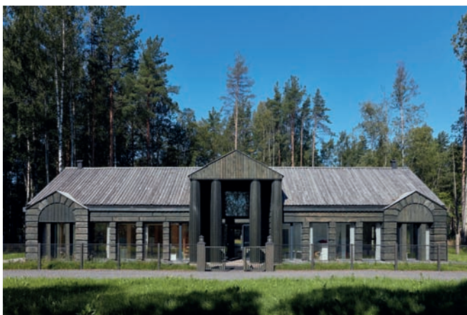
Рис. 9. Школа-мастерская. Архитектор А. Никифоров. Посёлок Репино, Санкт-Петербург. 2020.