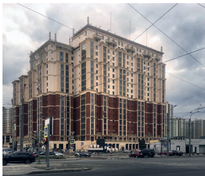
Рис. 8. Квартал «Ренессанс». Архитектор С. Липгарт. Санкт-Петербург. 2019 год. Фото предоставлено автором проекта