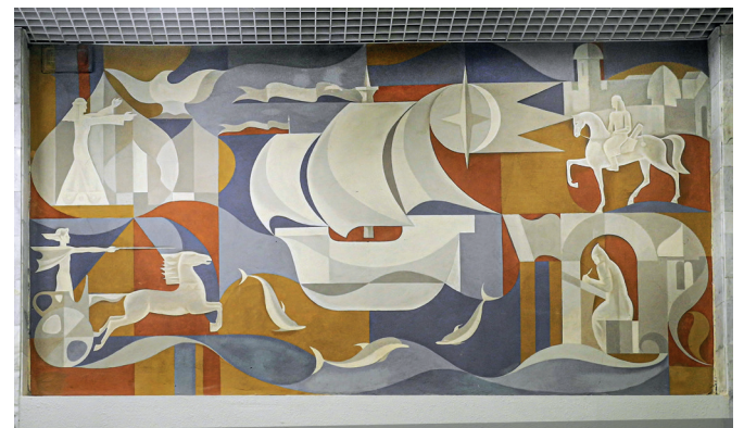
Рис. 8. Панно в интерьере Дома связи. Художник А. Краев. 1970-е годы. Улица Большая Покровская, 5б