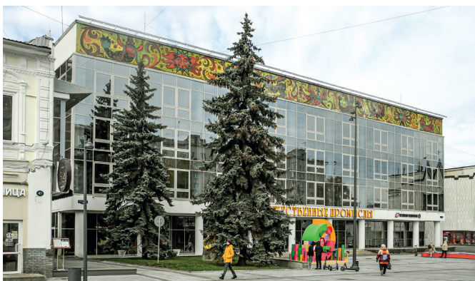
Рис. 4. Панно «Художественные промыслы». Художники К. Шихов, Д. Макаров. 1974 год. Улица Б. Покровская, 43