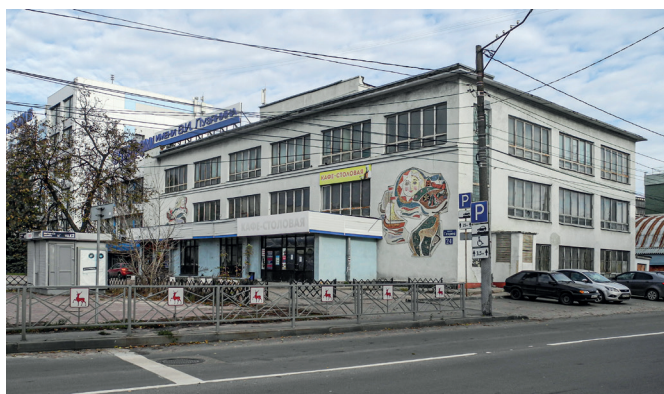
Рис. 6. Панно-диптих «Сказка». Художник В. Любимов. 1968 год. Проспект Гагарина, 24