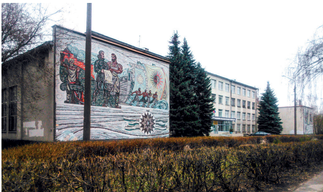
Рис. 5. Панно «Корабелы». Художники Д. Арсенин, А. Павлов. 1971 год. Улица Адмирала Нахимова, 10А

Тем не менее в Горьком можно встретить примеры, когда функция объекта и композиционный замысел декоративного элемента на его фасаде никак не связаны. Так, две части