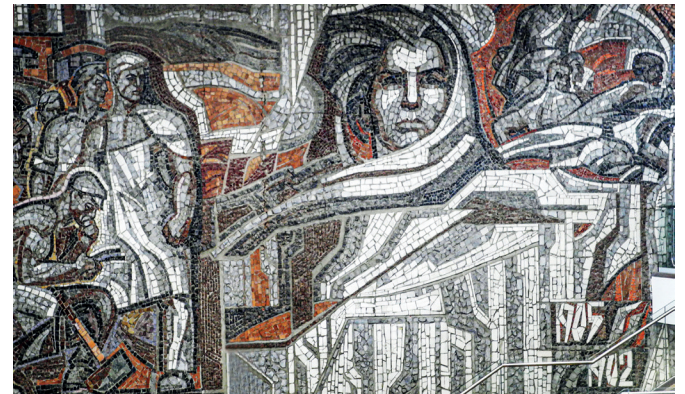
Рис. 7. Монументальное панно «Революционное Соромово». Руководитель творческой группы В. Любимов. 1971 год. Здание Московского ж/д вокзала, площадь Революции, 2а