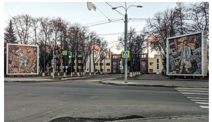
Рис. 9. Панно перед главной проходной ГАЗ на проспекте Ленина. Художники И. и В. Каленские. 1971 год