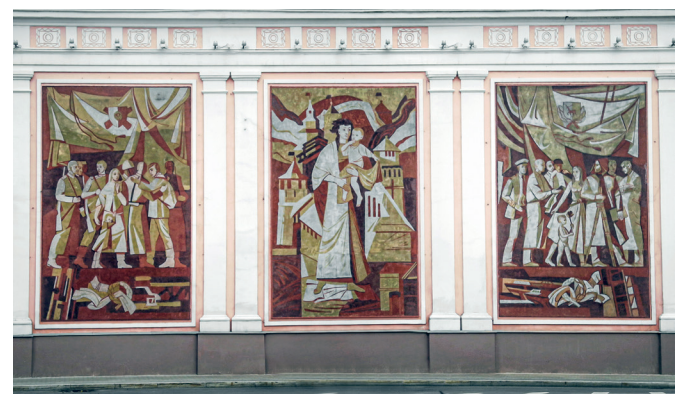
Рис. 10. Триптих «Связь времён – прошлое и настоящее нижегородцев». Художник В. Арискин. 1987 год. Улица Рождественская, 49