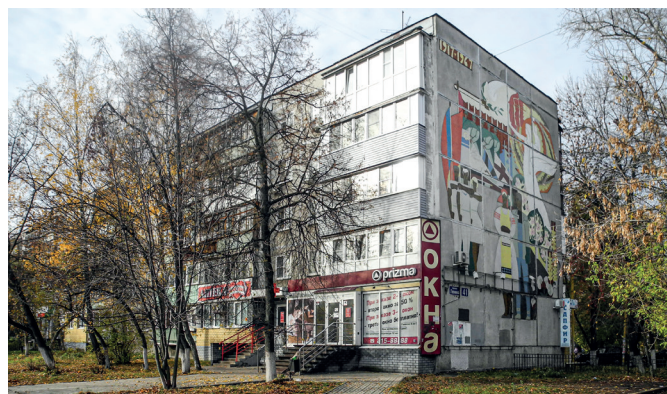
Рис. 1 2 . Панно «1917–1967». Художник В. Любимов. 1966 год. Проспект Ленина, 41

ским художником-монументалистом Валентином Любимовым в 1966 году [3]. Контрастные, красочные мозаики иллюстрируют наиболее актуальные для советского времени темы о покорении космоса (мозаика «Готовимся в полёт»), развитии техники (мозаика «Покорение неба»), ценности спорта (мозаика «Регата») и дружбы (мозаика «Дерево дружбы»). Двумя годами позднее на фасаде рядом стоящего дома появилась ещё одна работа Валентина Любимова: «Команда. Парусный спорт» [3].