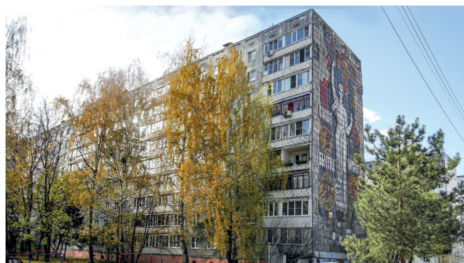
Рис. 2. Панно «Быстрее, выше, сильнее». Художник В. Любимов. 1979–1980 годы. Улица Берёзовская, 118