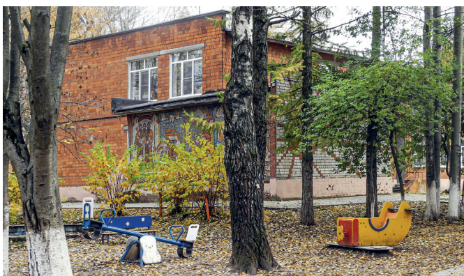
Рис. 3. Мозаика «Садко». Художник В. Любимов. 1969 год. Микрорайон Щербинки-1, 31

Монументальная живопись оказалась востребованной не только в структуре жилых микрорайонов, но и среди объ-