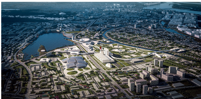
Рис. 1 8 . Мастер-план Якутска