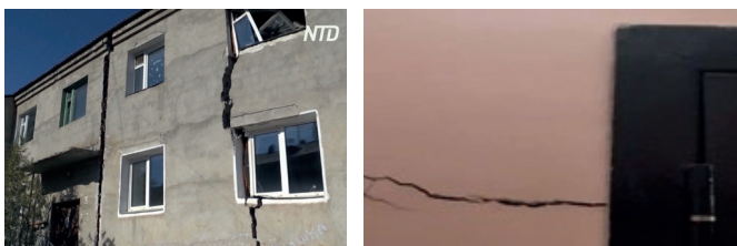
а) б) Рис. 2. Примеры разрушения домов из-за таяния вечной мерзлоты: трещины в фасадной; трещины в стенах квартиры на первом этаже дома в элитном 203 микрорайоне Якутска

Саха (Якутия) от 08.09.2021 № 2046 «О развитии города Якутска – столицы Республики Саха (Якутия) на период до 2032 года» миссия города определена так: «Якутск – лучший для жизни человека город в мире на вечной мерзлоте» 9 .