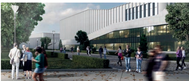
Рис. 4. Общественное пространство московского стадиона «Динамо» («ВТБ Арена»). Вид на Академию спорта «Динамо» со стороны Главной аллеи