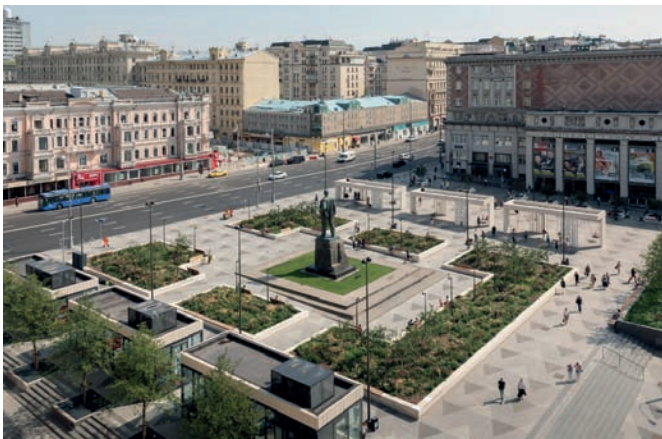
Рис. 1 4 . Общественное пространство Триумфальной площади в Москве. Общий вид