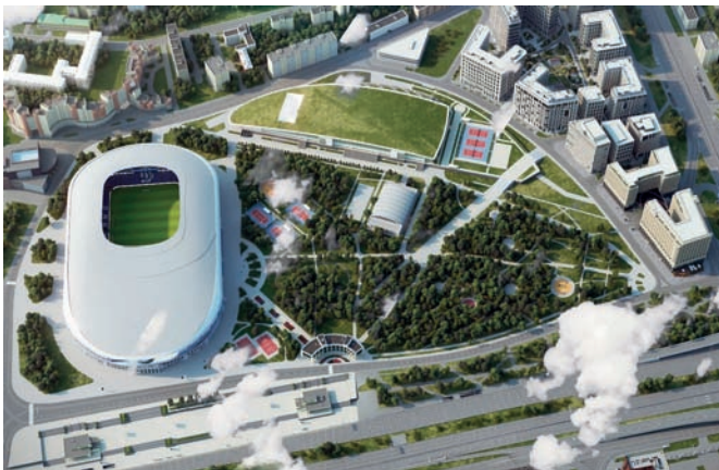
Рис. 3. Общественное пространство московского стадиона «Динамо» («ВТБ Арена»). Общий вид

Признаки ОП в отношении общедоступности, назначения и благоустройства в окружении стадиона «Динамо» отмечаются с момента завершения проекта реконструкции 1933 года [13]. Арена служит его смысловым и композиционным центром и может быть отнесена к типу «акрополь» [14]. Его полноценному формированию препятствовали функциональная неопределённость, вызванная конкуренцией с Парком физкультуры и отдыха; отсутствие границ и избыточная