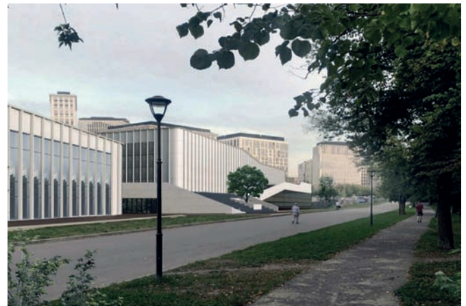
Рис. 5. Общественное пространство московского стадиона «Динамо» («ВТБ Арена»). Вид вдоль Диагональной аллеи в сторону нового квартала ВТБ Арена Парк

Исследование показывает непосредственное влияние культурно-исторической традиции на архитектурное формирование ОП в настоящем и требует определения тенденций