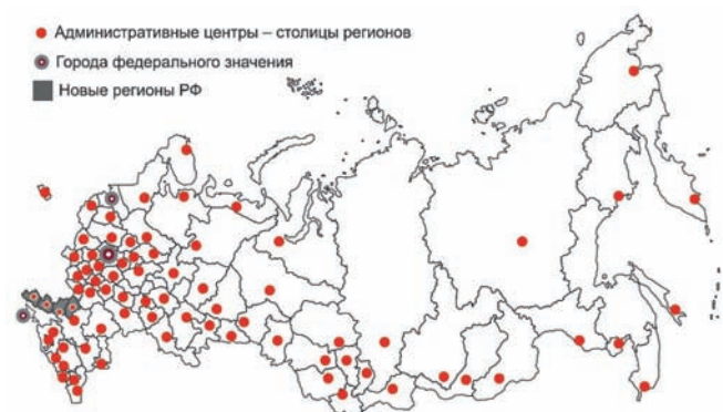
Рис. 2. Регионы Российской Федерации и их столицы

Неоспорима роль региональной идентичности в современных процессах выстраивания самоосознания российского народа и формирования идентичности нации. Архитектурно-пространственная среда главного города региона максимально ярко отражает, демонстрирует все нюансы и оттенки региональной специфики, кроме того, архитектурная среда столицы должна в полной мере отражать особенности своего статуса.