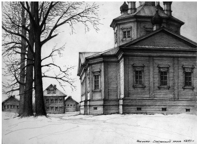
Рис. 6. Сретенская церковь. 1892–1894 годы. Восточная алтарная часть. Реконструкция А.Б. Бодэ.

вый храм, хоть и являлся тёплым и пятиглавым, унаследовал функцию, но не композицию разобранной церкви. Проект Э. Крауспа, по которому была сооружена Сретенская церковь в Чекуеве, на протяжении 1890-х годов был использован и при возведении ряда других храмов в различных уездах обширной Архангельской губернии – Колежемском,