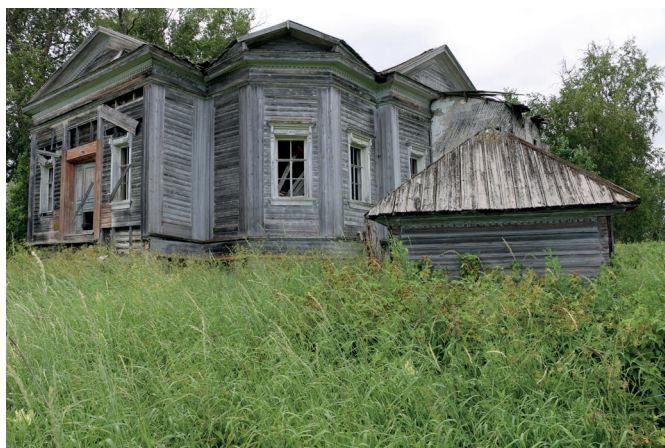
Рис. 8. Сретенская церковь с разрушениями XX века и Покровская часовня (на переднем плане). 2019 год

РГАДА – Российский государственный архив древних актов; ГААО – Государственный архив Архангельской области; РГА ВМФ – Российский государственный архив Военно-морского флота РНБ – Российская национальная библиотека;