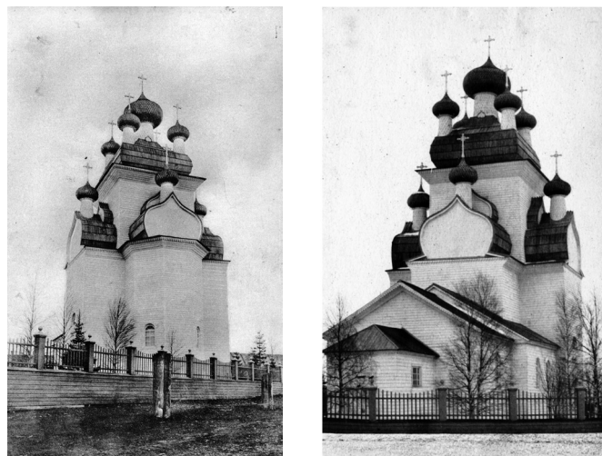
а) б) Рис. 1. Преображенская церковь в селе Чекуеве Онежского уезда. 1687 год: а) открытка начала XX века. Издательство А.П. Булычевой (источник: Архангельский краеведческий музей КП-48977/660); б) фото А.М. Вихман начала XX века (источник: Архангельский краеведческий музей КП-19421. № ГК: 28492490)

тому моменту колокольню, которая нуждалась в поправке крыши: «...находящаяся в оном приходе колокольница в высоту от фундамента до кровли, что под колоколами, около десяти сажень, над колоколами построен неумеренно высокой шатер с главою и крестом, каковые имеются на огромных деревянных старинных церквах. Оный шатёр утверждён на столбах недостаточной толщины. На колокольнице разной величины колоколов имеется до десяти, из которых большой более ста пудов. Священник того прихода Фёдоров объявил ему Архимандриту, что колокольница по причине тяжести Колоколов и неумеренно высокого шатра вовремя звону чувствительно шатается, от чего предвидится опасность, дабы от Сильных ветров оная совсем не опрокинулась... По сей причине оный священник Фёдоров, по настоятельному требованию прихожан не согласился тогда новокупленного