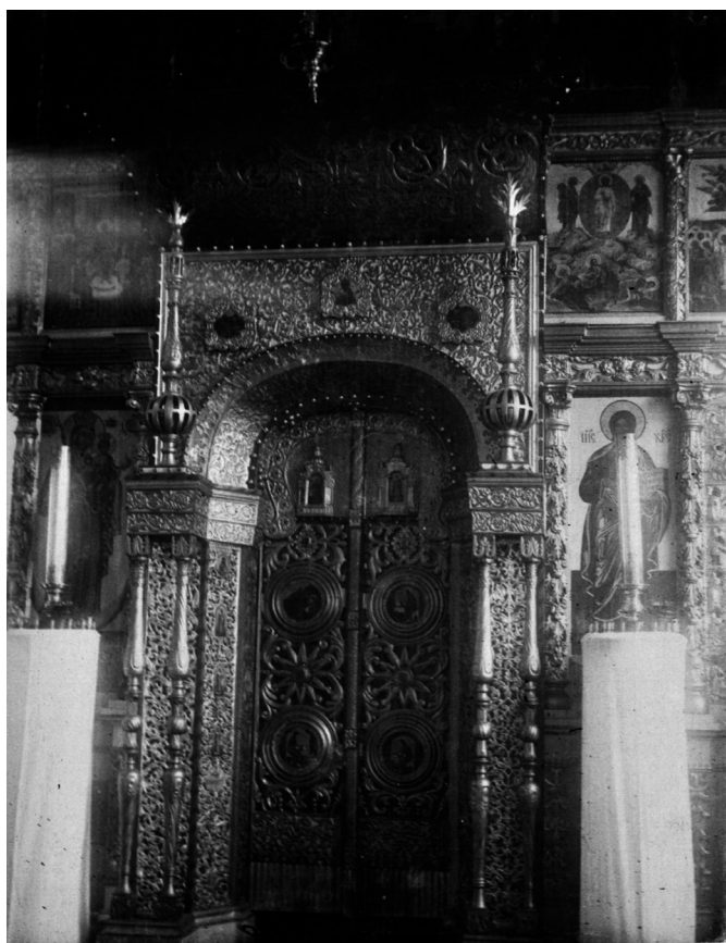
Рис. 7. Царские врата в Сретенском храме в селе Чекуеве Онежского уезда Архангельской губернии. 1900–1910 годы

Тамицком, Покшенгском и Церковническом приходах. Эти церкви представляют, пожалуй, единственную серию построек с усложнённой за счёт трёх приделов композицией восточного фасада (рис. 6). На представленной фотографии первой половины XX века ансамбль Чекуевского прихода (см. рис. 3) представлен с новой Сретенской церковью, что ещё раз подчёркивает значимость исследований В.В. Сулова, успевшего зафиксировать прежний кубоватый Сретенский храм 1677 года. В фондах Архангельского краеведческого музея сохранилась фотография Царских врат Сретенского храма начала XX века (рис. 7).