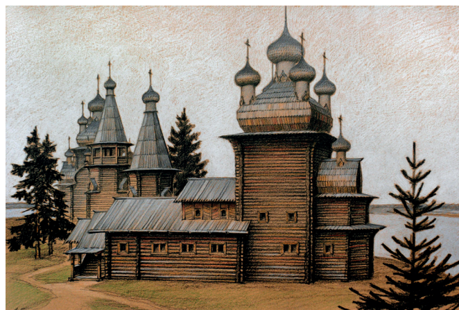
Рис. 2. Храмовый комплекс в Чекуеве. XVII–XVIII века. Реконструкция А.Б. Бодэ