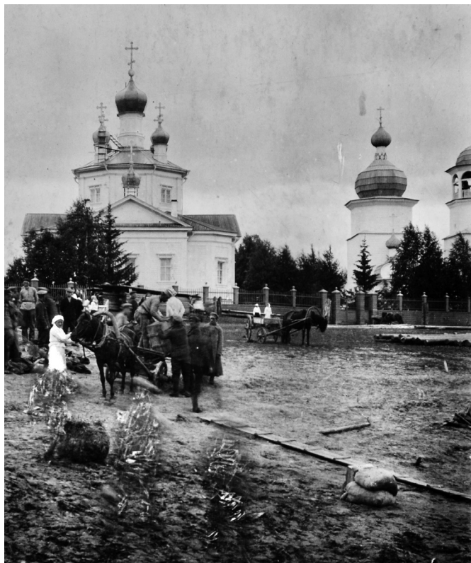
Рис. 3. Село Чекуево Онежского уезда. 1919 год

После возведения колокольни в 1740 году работы в Чекуевском приходе были связаны с устройством новых приделов в древних храмах, различными ремонтами и пристройками. Так, уже в 1779 году в Сретенской церкви был устроен Никольский придел, ранее находившийся в Преображенской 7 , где вместо него уже позднее были освящены приделы в честь