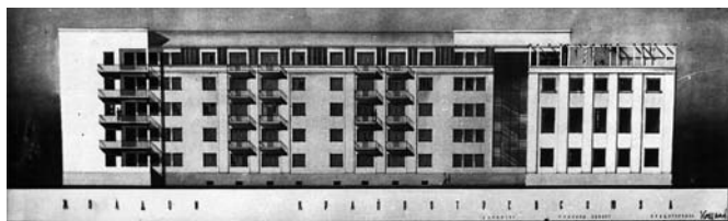
Рис. 4. Дом Крайпотресоюза. Проект. Архитектор В. Кочедамов. 1935 год