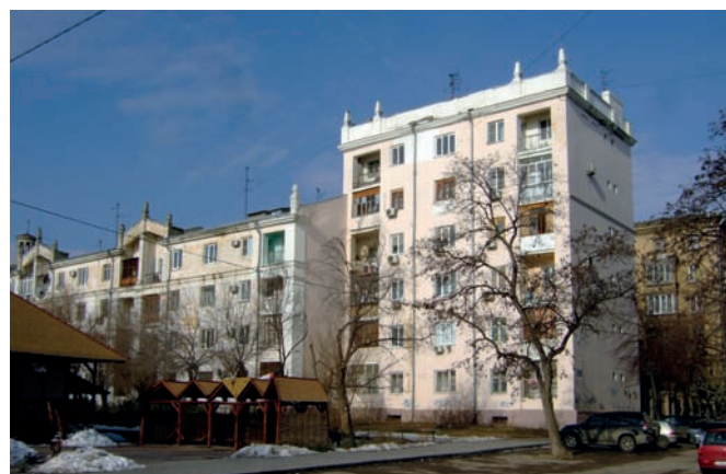
Рис. 18. Восстановленный корпус «А» дома специалистов на 300 квартир. Волгоград.