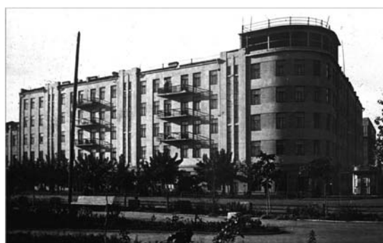
а) б) в) Рис. 6. Дом Горько. Архитектор А.В. Дроздов. Фото 1930 года: а) перспектива; б) план; в) Дом лётчиков