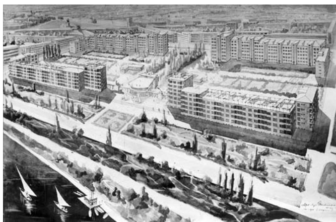
Рис. 12. Дом специалистов на 300 квартир на набережной Волги. Архитекторы В. Кочедамов, И. Ткаченко. 1932 год