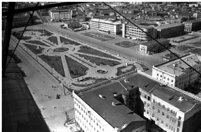
Рис. 11. Дом Легпрома на площади Павших борцов

града, располагавшееся на Привокзальной площади, на углу улиц Коммунистической и Гоголя (рис. 10). Оформленный колоннами скруглённый угол семиэтажного здания, построенного к 1937 году (арх. А. Дроздов, И. Иващенко, Р. Ситчиков и др.), придаёт облику здания особую выразительность. Этот