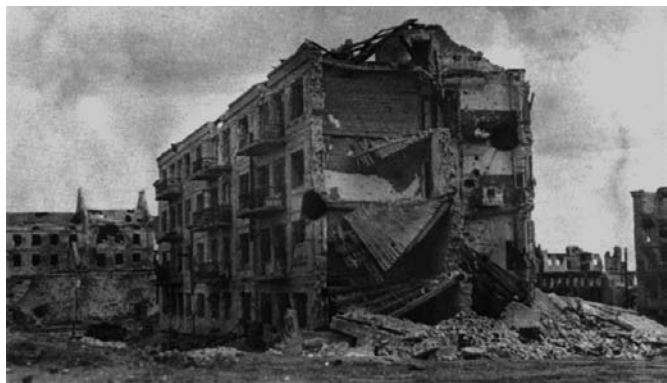
Рис. 16. Разрушенный дом Облпотребсоюза (Дом Павлова). Сталинград. 1943 год

стройный хоровод белых колонн на изгибе здания был первым впечатлением пассажиров, прибывавших в Сталинград по железной дороге, сразу по выходе из здания вокзала.