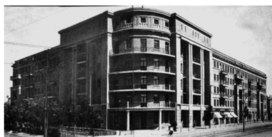
а) б) в) Рис. 7. Дом переходного типа завода «Красный Октябрь» («Комсомольский дом»). Архитектор В. Кочедамов. 1931 год: а) проект. Перспектива; б) фото 1931 года Рис. 8. Жилой Дом грузчиков на улице Рабоче-Крестьянской. Архитектор Летюшев. 1936 год