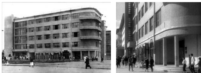
а) б) Рис. 3. Административно-жилой дом Легпрома на площади Павших Борцов. Архитекторы В. Кочедамов, И. Иващенко. 1932 год: а) общий вид; б) входная зона отделения Комбанка

Ещё одним примером такого жилого дома с общественными функциями мог бы служить дом Крайпотресоюза (рис. 4), который предполагалось построить на площади 9 января (арх. В.И. Кочедамов). Здание разделялось на две части: