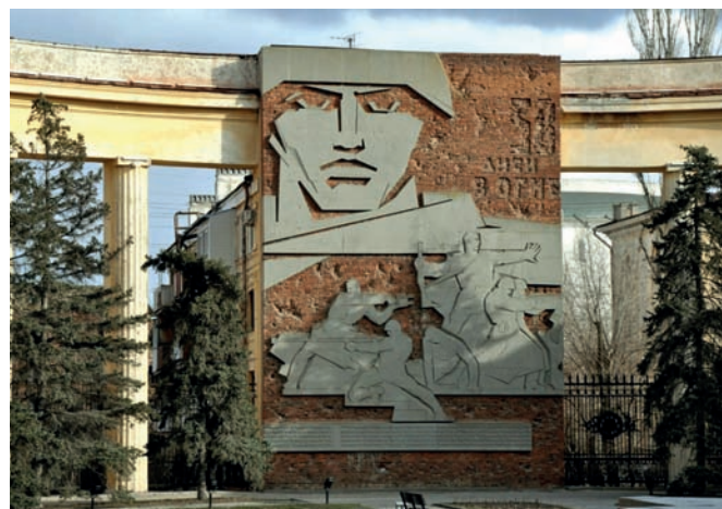
Рис. 17. Барельеф «58 дней в огне» на торце дома Павлова. Волгоград

СНК СССР – Совет Народных Комиссаров СССР Союза Советских Социалистических Республик;