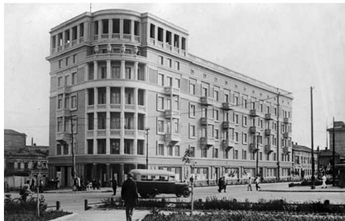
Рис. 9. Жилой Дом консервщиков на улице Рабоче-Крестьянской. Архитектор М. Цубикова. 1936–1939 годы. Фото П. Олейникова Рис. 10. Дом коммунальщиков. Архитекторы А. Дроздов, И. Иващенко, Р. Ситчиков и др. 1933–1937 годы (источник: [7, с. 11])