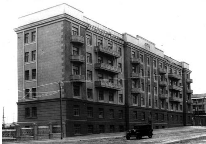
Рис. 5. Жилой дом НКВД на ул. Пензенской. Архитектор В. Кочедамов. 1935 год

жилую (пятиэтажную) и административную (трёхэтажную). Между ними предполагалось сделать лестницу с витражным остеклением. Над верхним этажом административной части здания планировалась открытая терраса с видом на Волгу. Однако этот проект не был реализован.