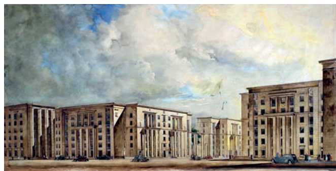
Е.А. Левинсон, И.И. Фомин, мастерская № 3 Ленпроекта. Перспектива застройки Дуговой магистрали (Ивановской улицы). Проект 1936 (?). ГНИМА ОФ-1388/5 Р Ia-5265