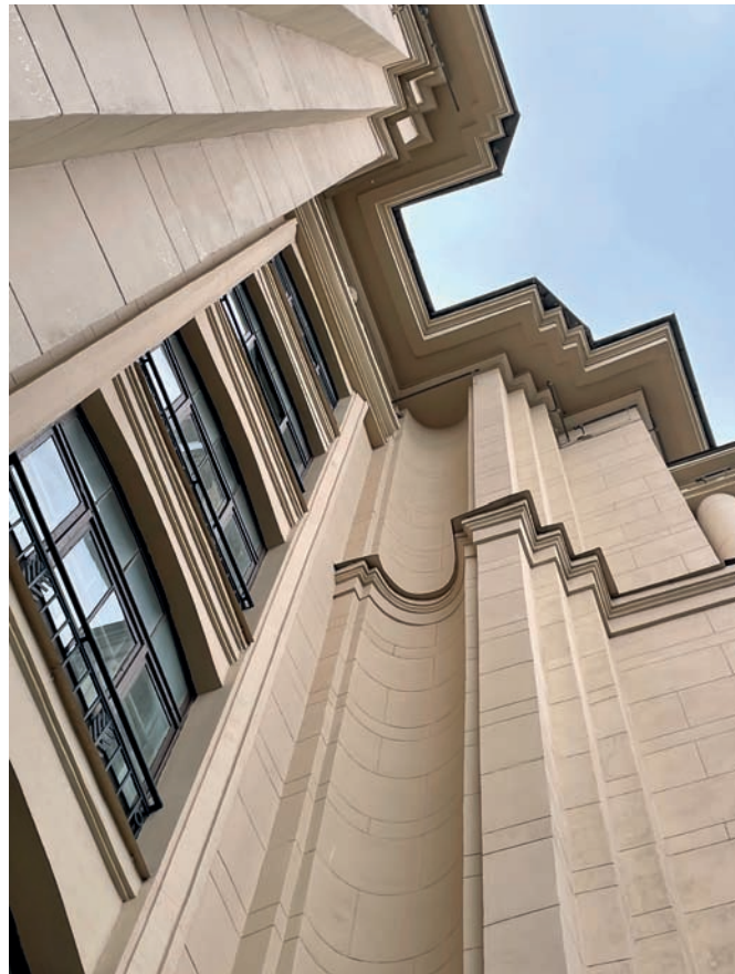
Жилой дом на Московском проспекте. Детали фасада. Фото 2022 года