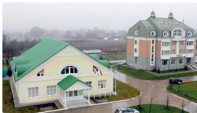
Рис. 10. Село Романово. Административное здание хозяйства и гостевой дом (справа)