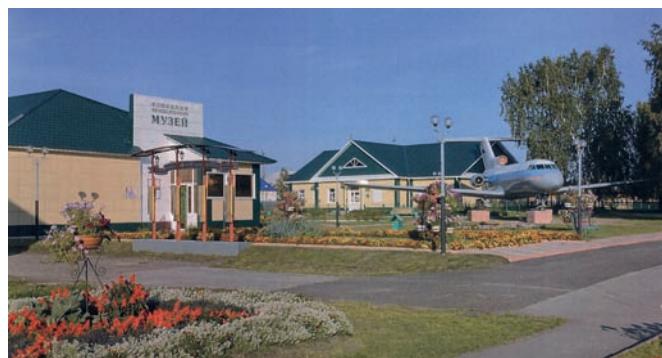
Рис. 5. Первомайское сельское поселение Первомайского района Томской области. Здание краеведческого музея и галереи искусств.