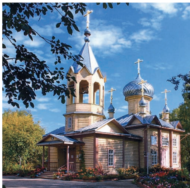
Рис. 4. Первомайское сельское поселение Первомайского района Томской области. Свято-Троицкая церковь