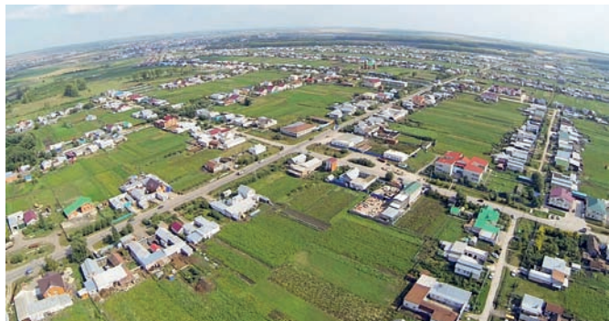
Рис. 6. Сельское поселение Шыгырдан Батыревского района Республики Чувашия. Общий вид с высоты птичьего полёта

На группу кварталов создаются квартальные мечети (рис. 7). Обычно они терракотового цвета с зелёной венчающей