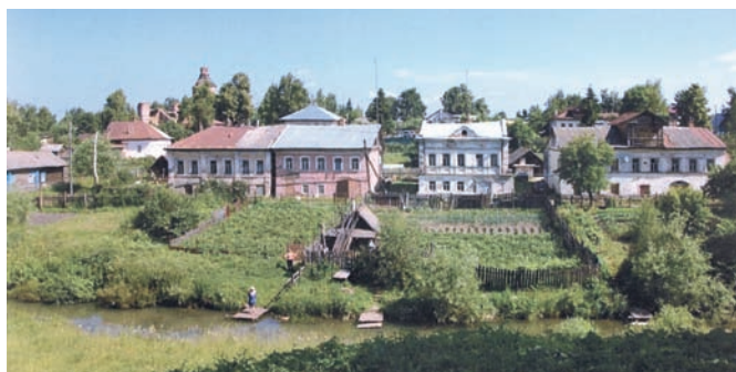
Рис. 12. Село Вятское Ярославской области. Жилая улица с двухэтажными жилыми домами гостиничного и пансионного типа

Несмотря на обилие сооружений для приезжих, село Вятское – не красивые декорации, а вполне обычный сельский