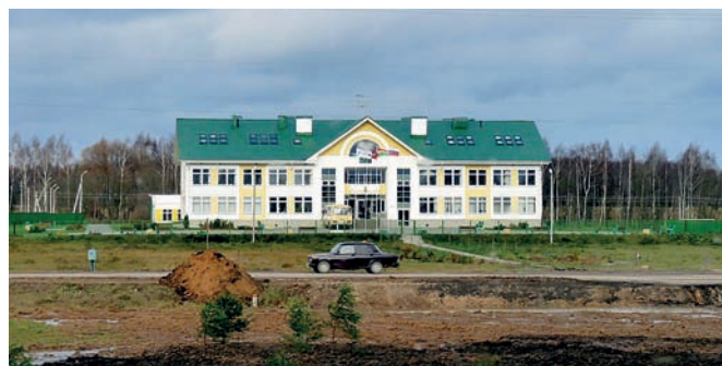
Рис. 9. Село Романово. Средняя школа на всё хозяйство

В селе сегодня работает около 10 музеев. Есть в селе экспозиция, посвящённая русской предприимчивости, музеи – торгового крестьянина, «Нумера купцов братьев Урловых», «Русская банька по-чёрному», экспозиция русских забав. Особенно интересны политехнический, музей кухонной машинерии, экспозиция «Детский мир».