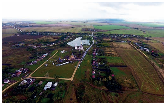
Рис. 2. Храм Иоанна Крестителя и кварталы жилой застройки (2016), с высоты птичьего полёта

С высоты птичьего полёта видно, что жилая застройка в виде больших кварталов несколько удалена от храма (рис. 2). Около храма организованы стоянки для транспорта приезжающих со всей округи.