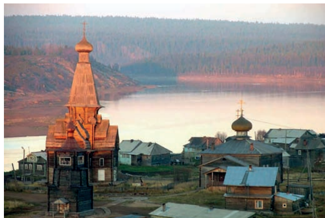
Рис. 11. Село Варзуга Терского района Мурманской области. Слева – Успенская церковь