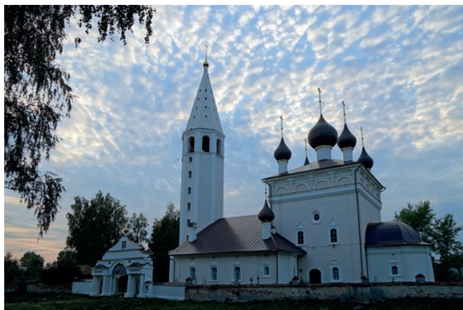
Рис. 14. Село Вятское. Храм Воскресения Христова

населённый пункт, в котором живут обыкновенные сельские жители и ремесленники.