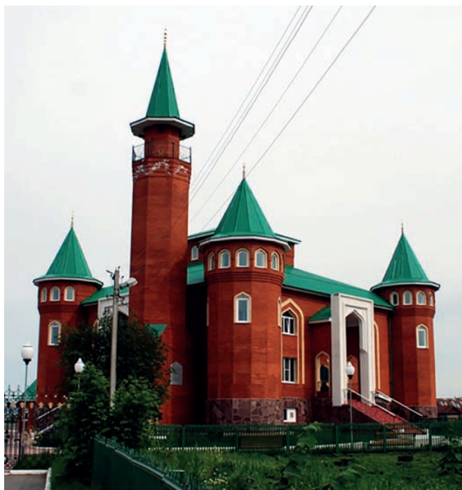
Рис. 7. Квартальная мечеть в сельском поселении Шыгырдан