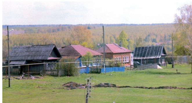
Рис. 3. Одноэтажная жилая застройка в селе Хирино

щий вид поселения, снятый с высоты птичьего полёта: жилые дома разнообразны и многоцветны – одно-двухэтажные, с внутренними дворами, с двусветными дворами, перекрытыми крышей, для хозяйственных работ в ненастное время,