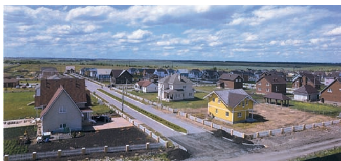
Рис. 8. Село Романово Медынского района Калужской области. Жилая застройка

частью. Хотя каждая мечеть имеет обязательные элементы – вход, балкон, минарет, но сочетание их различно, что придаёт каждой мечети свой облик.