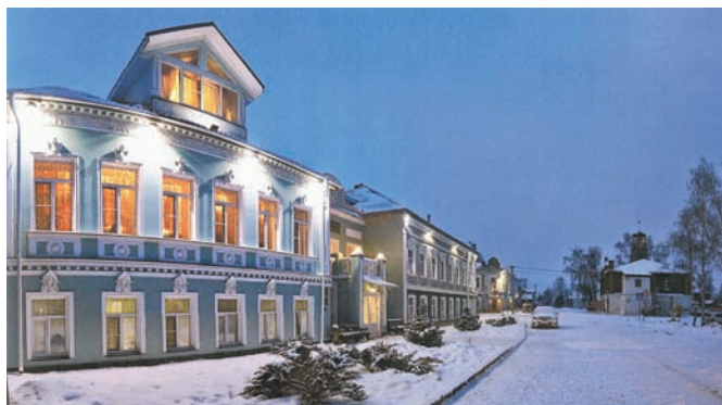
Рис. 13. Село Вятское. Улица с музеями и аттракционами для туристов