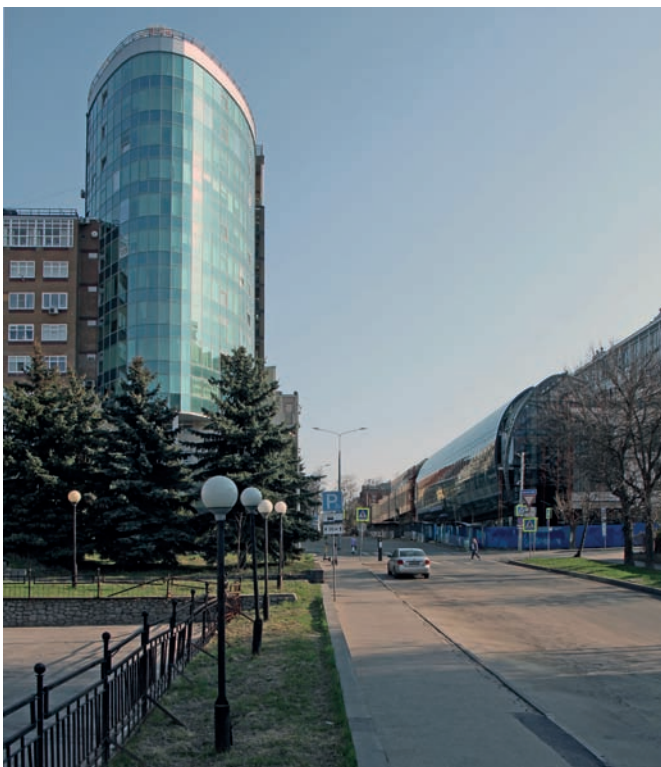
Рис. 8. Диалог форм на пересечении ул. Ульянова и Нестерова. Административно-жилой комплекс «Цепеллин» («Архстрой») и строящееся здание 2-ой очереди ЖК «Респект». Фото М.В. Дуцева. 2025 год

Симптоматично, что в вопросе образности города мы сталкиваемся с целым рядом разнонаправленных суждений, что указывает на объёмность данной темы. Приведём некоторые из них с целью увидеть разницу между пространственным ощущением и его эстетикой, между спонтанным чувством и устойчивым человекомерным пространством, находясь в целом в области поэтики. Последовательным примером зрелого эстетического подхода могут послужить работы Камилло Зитте, в частности, его книга «Художественные основы градостроительства» (1889). Для Зитте градостроительство – наука о взаимоотношениях (цит. по: [4, с. 107]). Речь идёт о связях человека и пространства, а не о «декорировании» места своего обитания. В краткой формуле обозначена абсолютно современная повестка, отсчитывающая урбанистический успех от возможностей реализации не только интересов, но и пространственных переживаний каждого индивида. В своем программном труде «Плоть и камень. Тело и город в западной цивилизации» Ричард Сеннет освещает ретроспективу городских пространств с особым вниманием к ритуалам и всему комплексу пространственных смыслов, разного рода антропных проекций, которые показывают неразрывную связь человека и его окружения. Автор пишет: «Один из запросов, который призван удовлетворить такой обобщенный образ тела, отражён в словосочетании «полити-