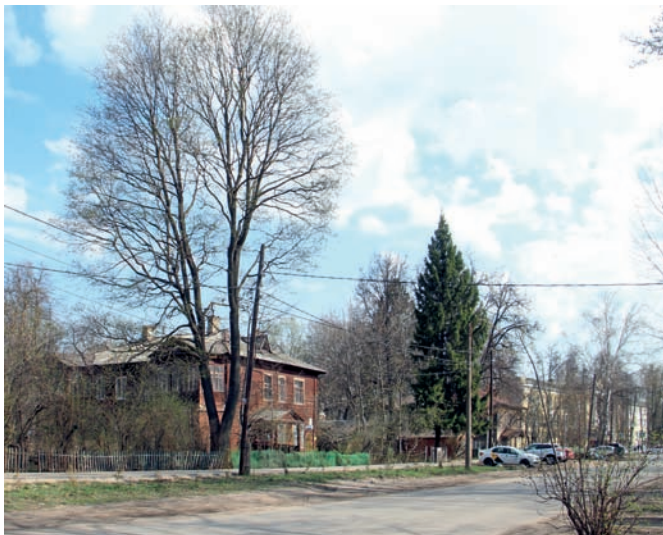
Рис. 3. Современное состояние квартала «Красный просвещенец». Вид с улицы Невзоровых. 2025 год

вым жилищным кооперативом в городе, построенным на тот момент на самой его границе, не раз менял название, но ни разу не изменял своей родовой функции (рис. 2). Есть основания считать, что архитектурно-планировочная организация была спроектирована по принципу города-сада, а в центре композиции размещён своеобразный «форум» и детский сад, который и ныне существует. Проводимые неоднократно экспертизы поочерёдно подтверждают или оспаривают преемственность говардовской утопии, что выступает одним из аргументов «за» или «против» постановки территории на охрану... Настолько ли это важно, если текущий быт жителей этого уникального пространственного образования подтверждает возможность существования «параллельных реальностей» в центре мегаполиса (рис. 3). Автономия совсем небольшого жилого района (на сегодняшний день это два квартала, один из которых уже утратил аутентичность) не столько пространственная, сколько концептуальная. С окру-