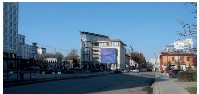
Рис. 5. Деловой центр «Айсберг». Архитекторы В. Быков, А. Сазонов, Д. Слепов. 2001 год. 2025 год

ветского времени, обусловившие определившие практически полную утрату исторической памяти на этом участке: деревянной застройки и церкви св. великомученицы Варвары, в честь которой и названа улица, ведущая к кремлю. Ещё не до конца сформированная на сегодня «площадь» являет удивительный гибрид автомобильной «развязки», парковки и общественного пространства перед концертным залом с замощением и сухим фонтаном для детей. Геометрии фасадов словно разворачивают, раскрывают пространство по всем направлениям: пространство, которое когда-то, исторически, было организовано застройкой вдоль улиц. Самая интригующая из вновь приобретённых геометрий – криволинейная поверхность ЦМТ.