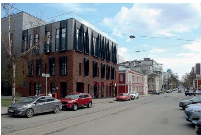
Рис. 4. Административно-офисное здание и культурный центр «Галерея» в контексте улицы (архитектурная мастерская Пестова и Попова). Виды по улице Ошарской. 2025 год

жающих улочек дворы легко просматриваются. Достаточно простая типовая двухэтажная застройка расположена среди живописных, местами сильно заросших садов. С известной степенью приближения и при вложении инвестиций данное место могло бы претендовать на статус респектабельного района городских вилл, являясь по факту наследием советских «народных строек».