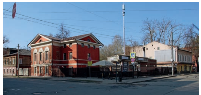
Рис. 6. Дом № 5/31 по улице Ошарской. Архитектор Г.И. Кизеветтер. 1843 год. 2025 год