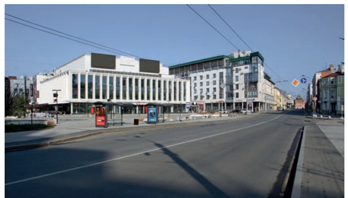
Рис. 7. Перспектива улицы Варварской, завершающаяся Дмитровской башней Нижегородского кремля. На переднем плане «МТС Live Холл», далее жилой дом (АПМ «Проспект»). 2025 год