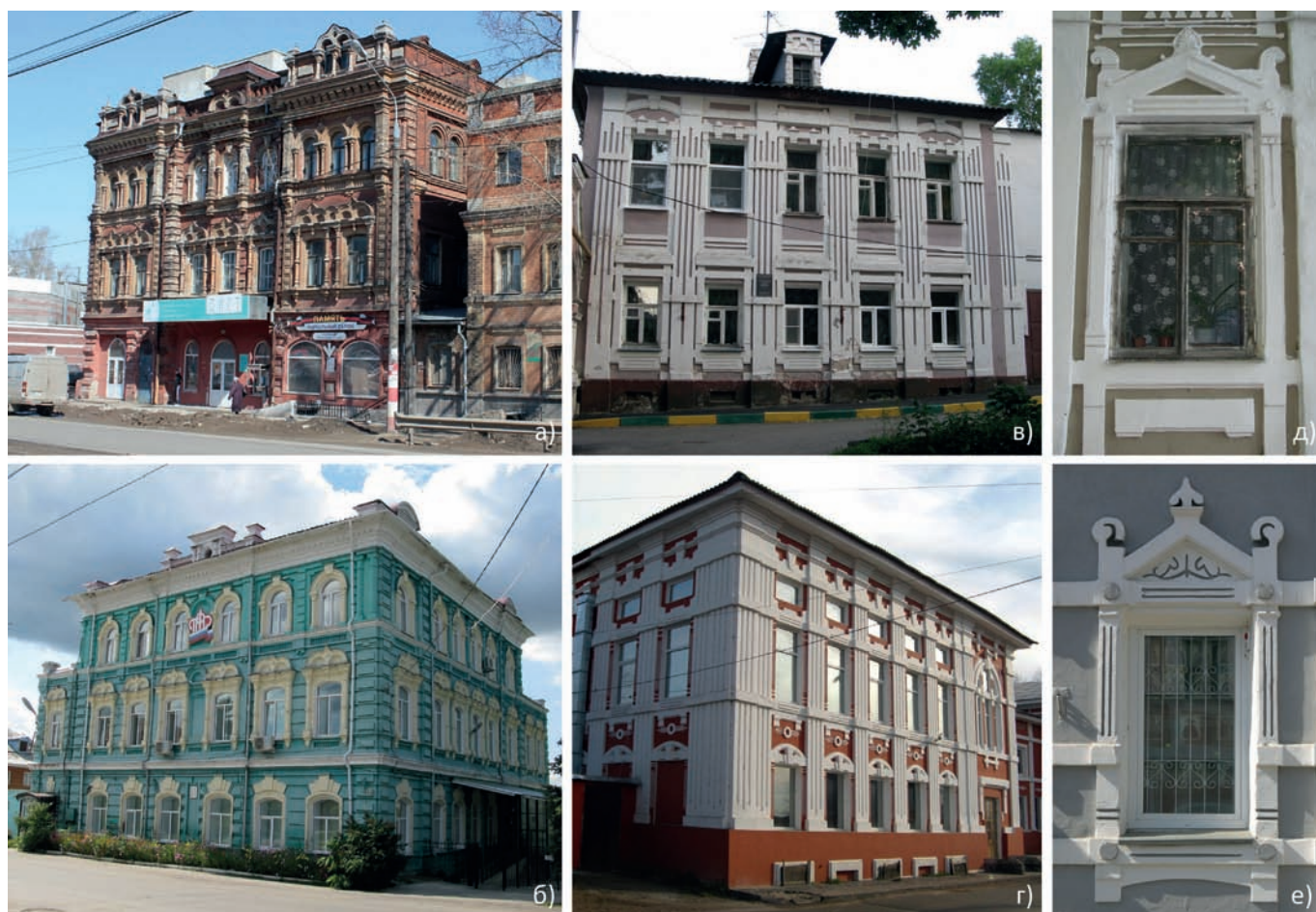
Рис. 5. Прямые заимствования. Фото О.Ф. Здоровой (2009) и А.В. Лисицыной (2015, 2019): а) дом И.А. Теребилина. Нижний Новгород, ул. Гордеевская, 61; б) дом И.С. Панышева. Большое Мурашкино, ул. Свободы, 91; в) дом Окуловых. Нижний Новгород, пер. Крутой, 8; г) дом П.И. Шадрина. Городец, ул. Горького, 118; д) наличник окна жилого дома. Нижний Новгород, ул. Звездинка, 36; е) наличник окна дома С.Ф. Тряпкина. Городец, ул. Ленина, 2

Учитывая анонимность большинства архитектурных объектов в малых городах и поселениях, сложно порой провести границу между авторскими произведениями и фактами прямого заимствования, буквального копирования – по принципу «увидеть и сделать так же у себя». Особенно широкое распространение такие повторения получили в декоративной отделке фасадов. Сопоставление архитектурного облика