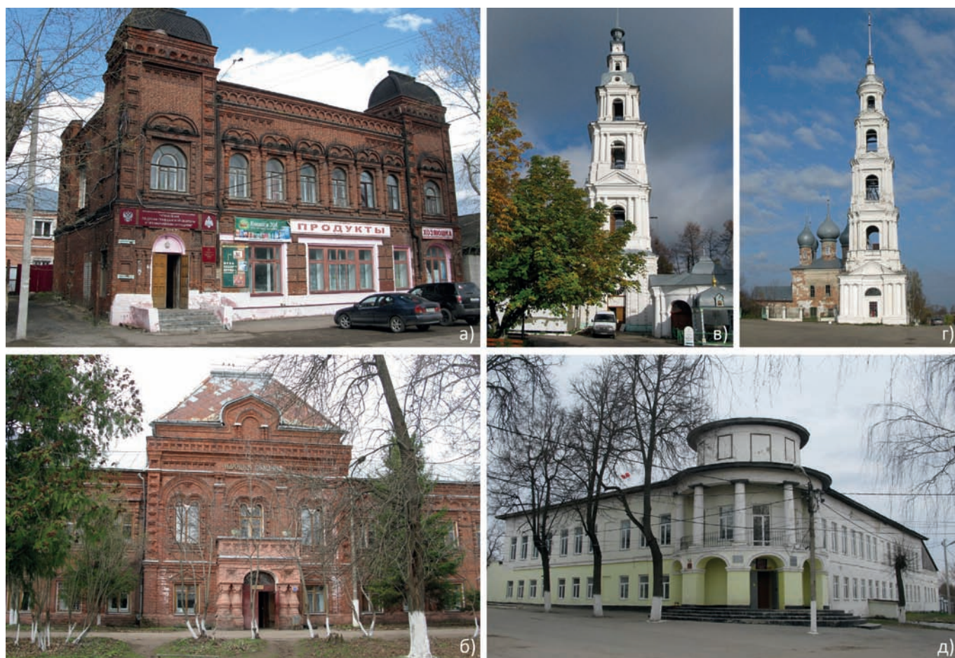
Рис. 9. Региональные черты архитектуры на территориях, граничивших с Нижегородской губернией. Фото А.В. Лисицыной (2012, 2017, 2018): а) гостиница И.П. Ширманова. Вязники, ул. Сергиевских, 5; б) здание земской больницы. Вязники, ул. Киселева, 72; в) колокольня Успенского собора. Кинешма, ул. Советская, 2; г) колокольня Входоиерусалимского собора. Юрьевец, ул. Советская, 39; д) здание женской гимназии. Касимов, пер. Школьный, 1

Прославленное древнерусское каменное зодчество Владимиро-Суздальского княжества определило стилистику общественных зданий рубежа XIX–XX веков не только в губернском Владимире, но и в подчинённых ему уездных городах. Эти выразительные постройки в русском стиле отличаются нарядными краснокирпичными фасадами, выразительным силуэтом с башенками, шатрами и куполами,