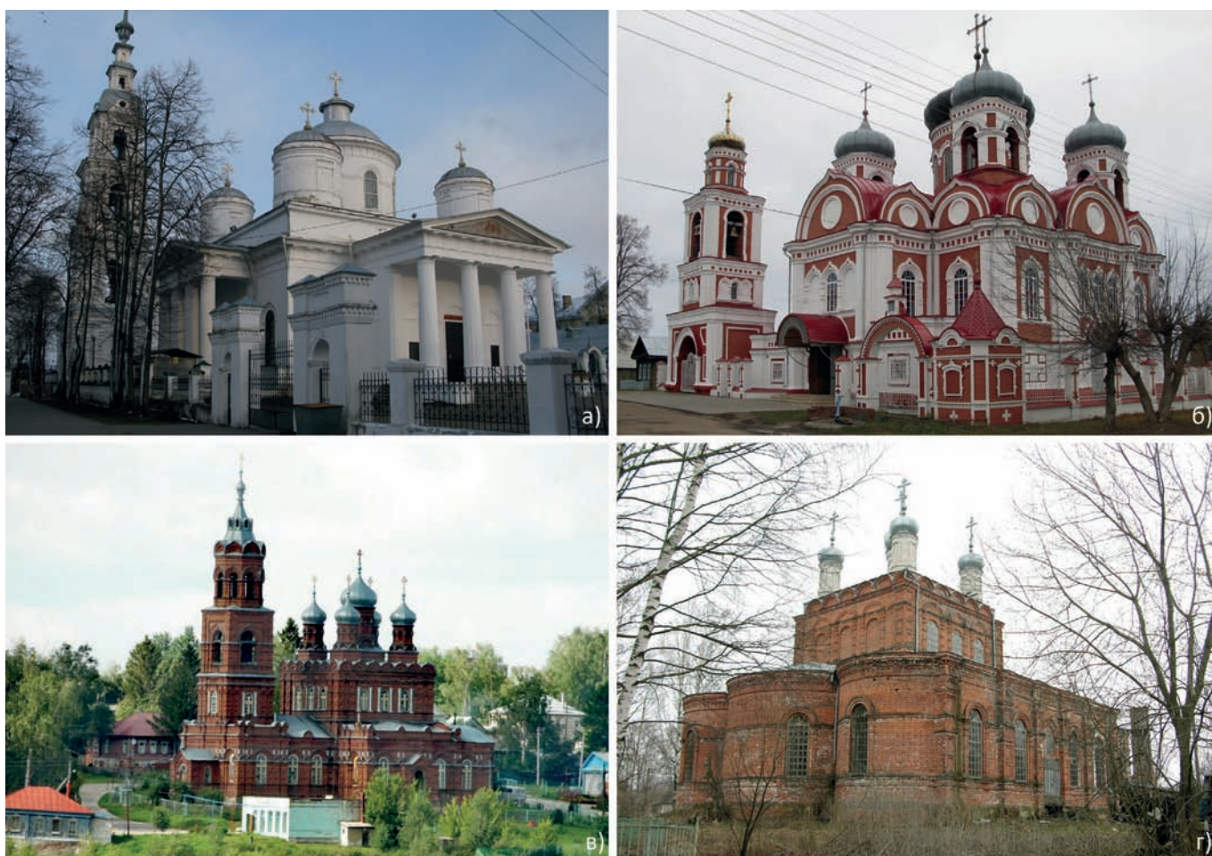
Рис. 2. Церковные здания по проектам нижегородских архитекторов. Фото А.В. Лисицыной. 2008, 2013, 2018 годы: а) Троицкий собор. Архитектор И.Е. Ефимов. Кинешма; б) Смоленский собор. Архитектор Н.И. Ужумедский-Грицевич. Козьмодемьянск; в) церковь Михаила Архангела. Архитектор А.К. Никитин. Село Семьяны; г) церковь святителя Алексия. Архитектор А.К. Никитин. Село Зиняки

Заметим, что выбор образцов в населённых пунктах происходил по-разному. Интересно сравнить каменные жилые дома первой половины XIX века в крупных торгово-промышленных сёлах Нижегородской губернии (рис. 3). В каждом из них преобладал лишь один морфотип уличного фасада. В Павлове и близкой к нему Ворсме это композиция с мезонином, увенчанным треугольным фронтоном, и трёхосным пилястровым портиком. Типичными элементами были «утопленные» лопатки на углах двухэтажных объёмов зданий. В Лыскове распространение получил двухъярусный фасад без мезонина. Трёхосная раскреповка по центру подчёркивалась особой формой окон второго этажа с полуциркульными перемычками. Лицевая кирпичная кладка стен служила фоном для лепных деталей и профилированных тяг. В Городце фасад в три оси окон, чередующихся с пилястрами, был соединён с крутой двускатной крышей, воспроизводившей форму крыш крестьянских изб. Анализируя жилые дома в Починках, следует отметить их небольшую высоту (один этаж с полуподвалом) и повторяющуюся симметричную композицию главного фасада с тремя арочными окнами в центре.