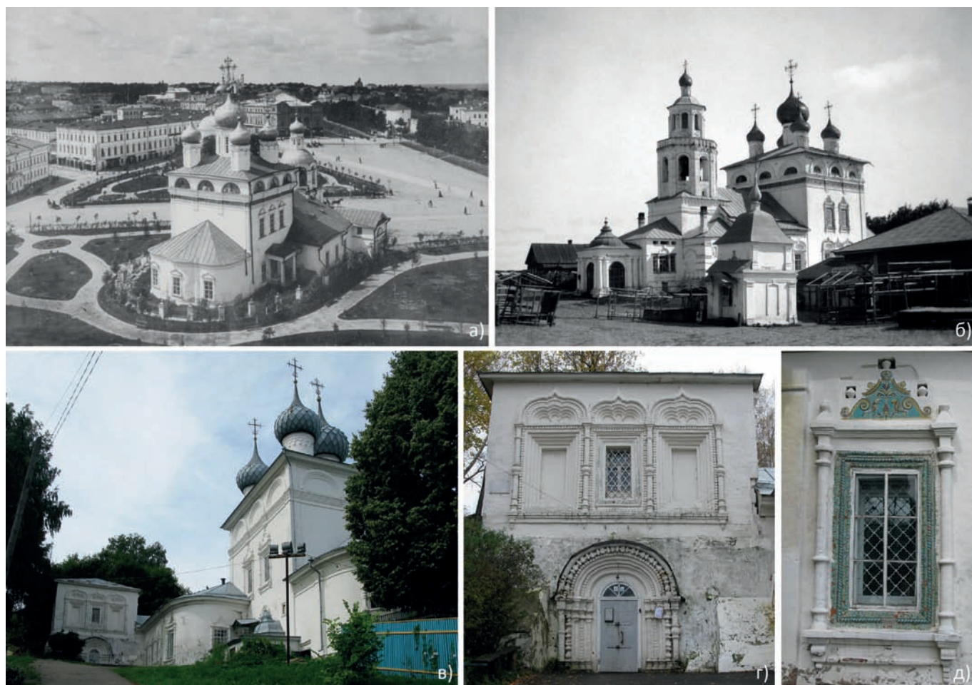
Рис. 1. Епархиальное церковное зодчество: а) церковь Благовещенья. Нижний Новгород (утрачена); б) церковь Благовещенья. Юрьевец (утрачена); в) церковь Богоявления. Юрьевец, пер. Тарковского, 6; г) фрагменты декора утраченной церкви Благовещенья, перенесённые на стену колокольни церкви Богоявления; д) наличник окна церкви Богоявления, украшенный изразцами балахнинского производства.