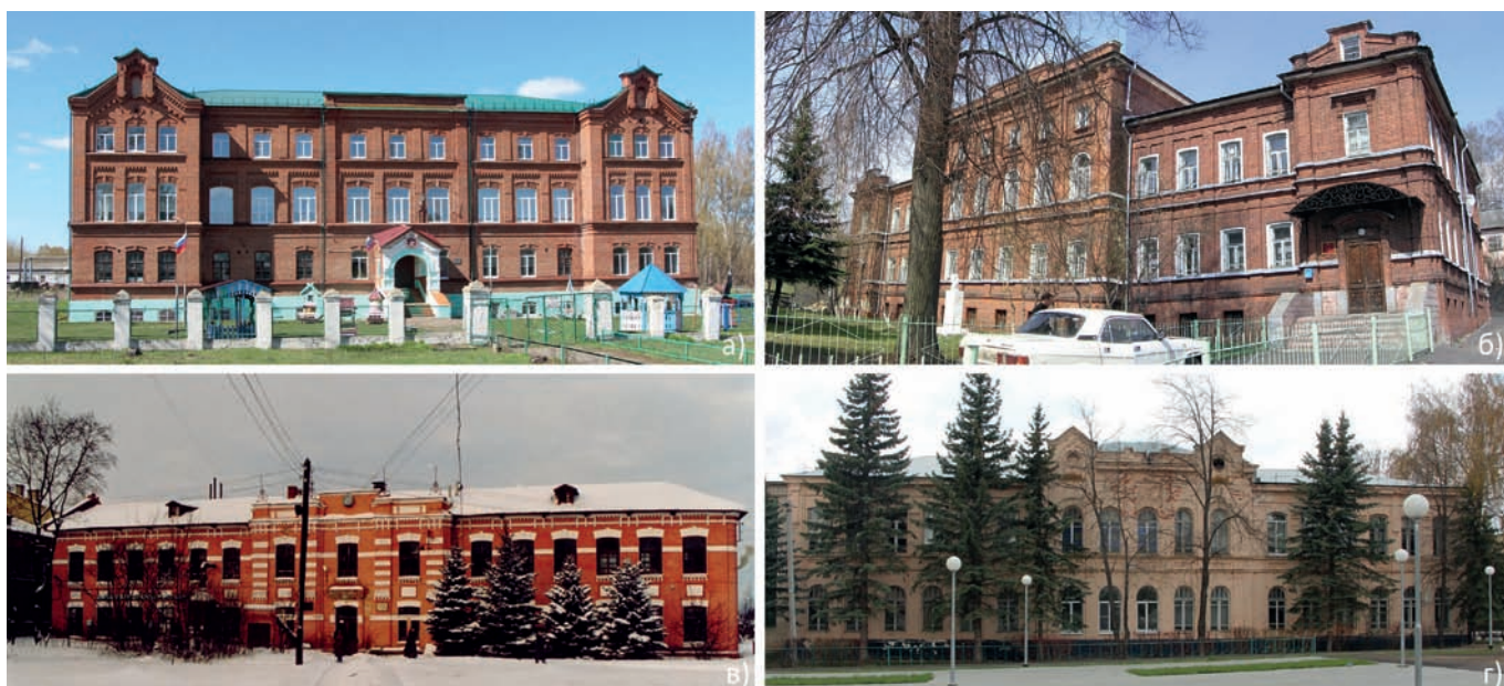
Рис. 4. Общественные здания по проектам нижегородских архитекторов. а) здание духовного училища. Архитектор А.К. Никитин. Починки, ул. Луначарского, 47; б) здание старообрядческой богадельни. Архитектор Н.А. Фрелих. Городец, ул. Зафабричная, 6; в) здание учебного кожевенного завода ремесленного училища. Архитектор П.А. Домбровский. Богородск, ул. Свердлова, 3; г) здание гимназии. Архитектор И.А. Самусь. Лукоянов, пл. Мира, 4