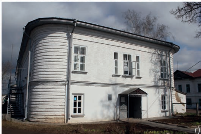
Рис. 6. Усадебное строительство помещиков-дворян. а) церковь Рождества Богородицы. Выкса, ул. Ленина, 69; б) охотничий домик Баташёвых. Досчатое, ул. Советская, 16; в) церковь Вознесения. Лысково, пер. Шапошникова, 7а; г) «зимний» дом князя Г.А. Грузинского. Лысково, пер. Кадушина, 7