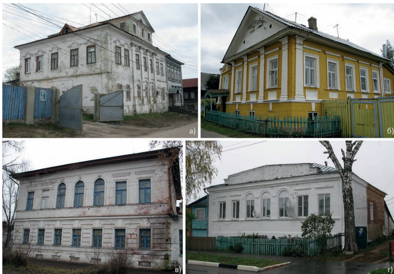
Рис. 3. Жилые дома по образцовым проектам начала XIX века Фото Я.Л. Шаболдина (2006) и А.В. Лисицыной (2008, 2015, 2022): а) дом В.И. Первого. Павлово, ул. Кольцова, 40; б) дом Н.И. Польского. Городец, пер. Кирова, 2; в) дом Д.И. Тяжелова – И.Л. Кудрявцева. Лысково, ул. Горького, 17; г) дом К.В. Орфанова. Починки, пл. Ленина, 3