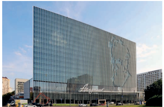
Рис. 11. Бизнес-центр «Академик». Архитектурное бюро «UNK-project». Москва. 2015–2019 годы

Достаточно своеобразное представление об идентичности времени дают мегапроекты и мегапостройки Саудовской Аравии: город Неом и его часть «Зеркальная стена»; «Куб Мукааб»; «Зеркальный куб» (рис. 12, 13, 14). Очевидно, что в развитии экономики, привлечении