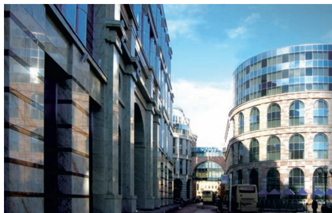
Рис. 9. Застройка пешеходной улицы центрального района. Архитектор М. Мамошин. Санкт-Петербург. 2001–2019 годы