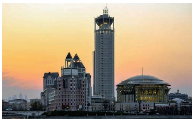
Рис. 6. Комплекс «Красные холмы». Архитекторы: Ю. Гнедовский, «Товарищество театральных архитекторов». Москва. 2003–2006 годы