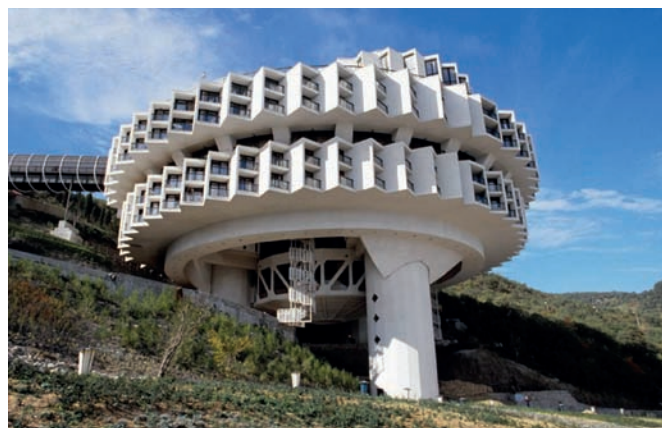
Рис. 2. Курпаты Крым. Пансионат «Дружба». Арх. И. Василевский Строительство – 1983–1985 годы