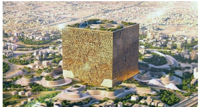
Рис. 13. Куб «Мукааб» (араб. – بعبكامل) – строящийся 400-метровый небоскрёб. 2030 год. Визуализация. Саудовская Аравия