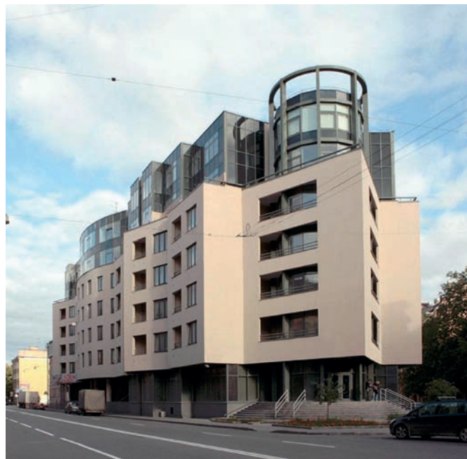
Рис. 8. Жилой дом на 10-й Советской улице. Архитектор Н. Явейн, «Студия 44». Санкт-Петербург. 2003–2006 годы

явно ощущается стремление авторов к достижению контекстуальности общего композиционного замысла (рис. 6). Жилой дом «Патриарх» (арх. С. Ткаченко, О. Дубровский и др., 2000),