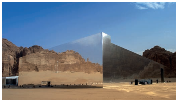
Рис. 14. Концертный зал «Марайя», или «Зеркальный куб». Архитектурная студия «Giò Forma». Регион Аль-Ула, Саудовская Аравия. 2018 год