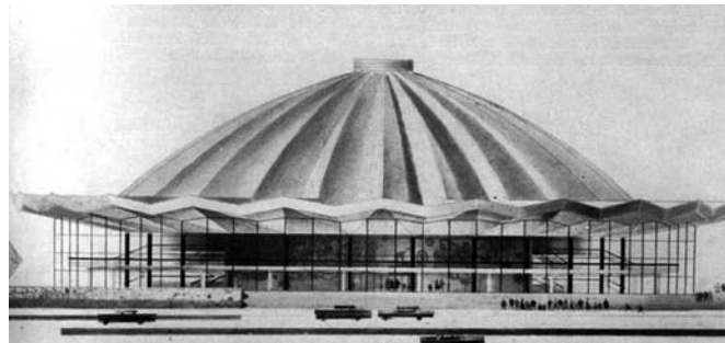
Рис. 1 3 . Москва. Здание цирка на проспекте Вернадского. Архитектор Я. Белопольский. Открыт в 1971 году

В это время в российской архитектурной науке появляются работы по выявлению, сохранению и экспонированию памятников истории и культуры 2 .