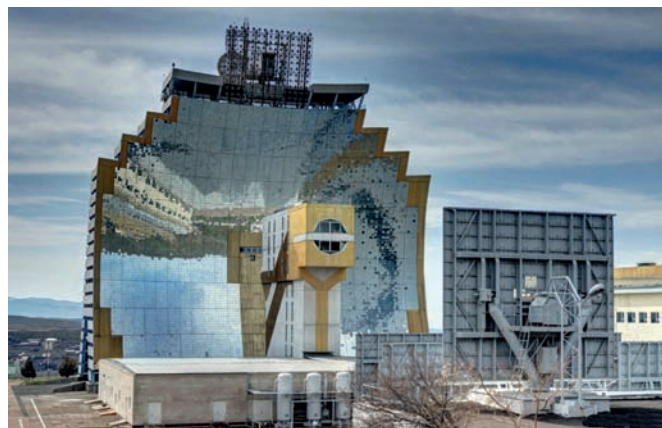
Рис. 3. Посёлок Чангихисарак, Узбекистан. Гелиокомплекс «Солнце» (солнечная печь). 1981–1987 годы