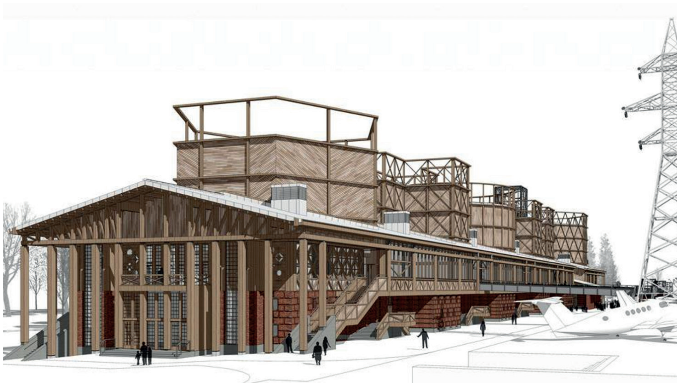
Рис. 8. Музей науки и техники. Томск. Архитектор Н. Явейн, «Студия 44». Проектирование: 2014–2015 годы

Идентичность времени рассматривается как вектор архитектуры нового рационализма, воплощающий сочетание многообразия технологических достижений архитектуры устойчивого развития [6] и уникальные фундаментальные качества локации, её природно-климатические и культурно-исторические характеристики.