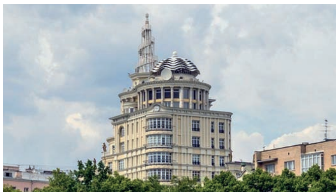
Рис. 7. Жилой дом «Патриарх». Архитекторы С. Ткаченко, О. Дубровский. Москва. 2000 год