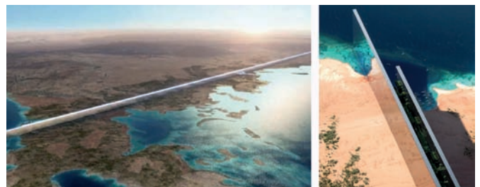
Рис. 12. Город «Линия», «Зеркальная стена». Неом, Саудовская Аравия