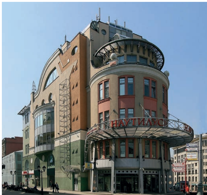
Рис. 5. Бизнес-центр «Наутилус». Архитектор А. Воронцов и др. Москва. 2000–2002 годы

довский; 2002–2005.) – грандиозный многофункциональный комплекс зданий в центре российской столицы, демонстрирует находки постмодернистской трактовки его облика. При этом