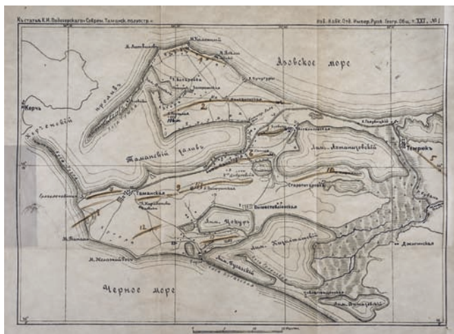
Карта Таманского полуострова в 1900 году