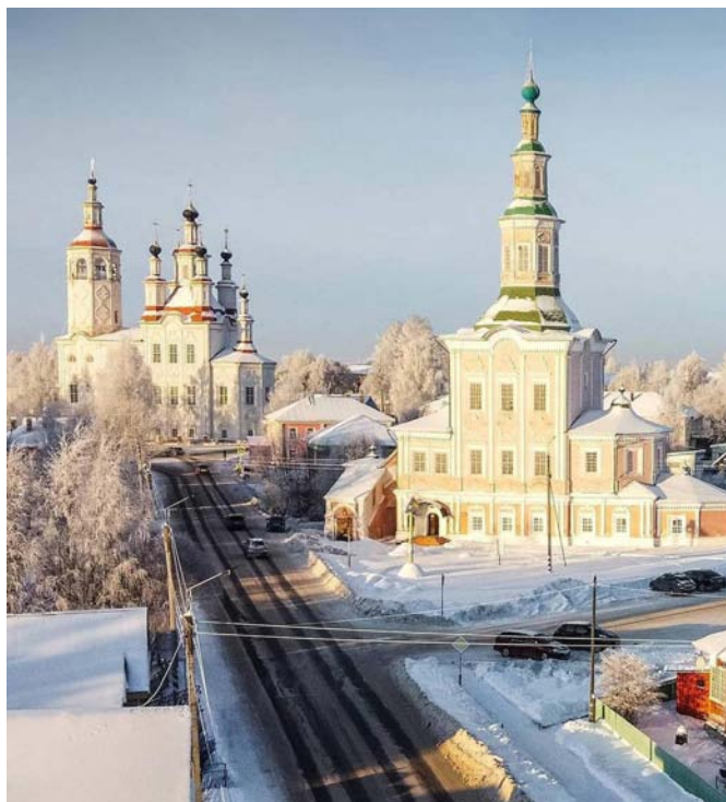
Тотьма. Вологодская область. Современное фото

Антология представляет обзор исторических поселений, в котором отмечена их функциональная специализация,