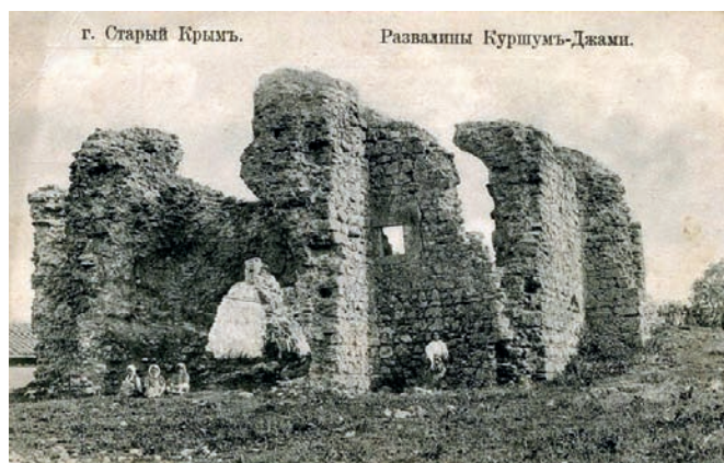
Старый Крым. Историческое фото

Необходимо отметить огромную роль всех принявших участие в подготовке и создании этого фундаментального издания.