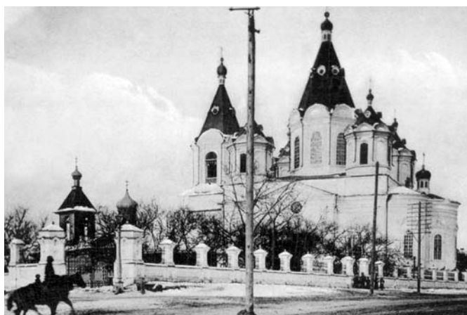
Благовещенск. Покрово-Никольский храм. Историческое фото

и культурно-историческое значение. Охарактеризованы следующие типы: