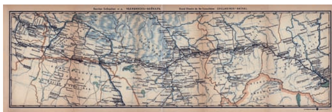
Фрагмент сложившегося и поддержанного правительством расселения в зоне Байкала – Приамурья