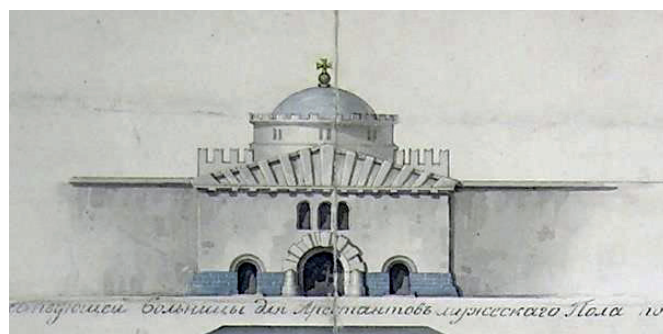
«Фасад вновь проектированный и утвержденный к постройке церкви над воротами тюремного замка». Проект 1831 год