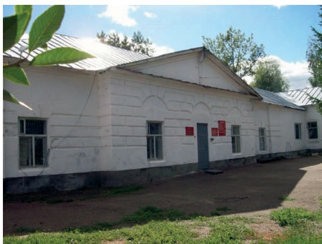
Здание тюремного замка в городе Мамадыше, построенное по проекту А. Захарова. 1803 год (1810).

Характеризуя существующее состояние казённых зданий в губернии, Мансуров в своём представлении подчеркнул «крайне бедственное положение» с присутственными местами. Из записки следовало, что в Казанской губернии большинство казённых строений были возведены в дереве ещё в XVIII веке (в частности, упоминались и датированные временем основания города присутственные места в Тетюшах, а также соляные магазины 1757 года). В некоторых городах казённых зданий вообще не было, и в этих случаях присутственные места размещались в наёмных обывательских домах. В ряде городов – Спасске, Тетюшах, Мамадыше и Свияжске – казённые