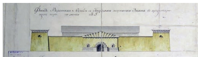
Фасад тюремного замка в Казани по проекту А. Захарова 1803 год (1807)

решение вопроса путём исправления на первых порах по возможности существующих строений: «составив планы на каждый род зданий и сообразив их через знающих архитекторов, сколько можно, с удобствами, с меньшими издержками и с добрым вкусом», разослать по губерниям для применения не только при проектировании новых зданий, но и при переделке старых строений («где можно и где удобность позволит»). Так