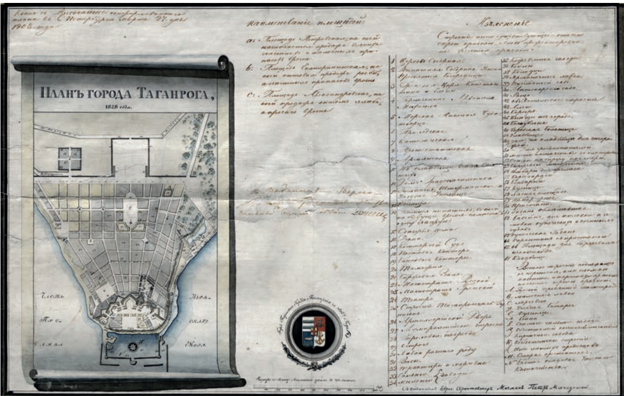
Рис. 4. План города Таганрога 1828 года. Публикуется впервые