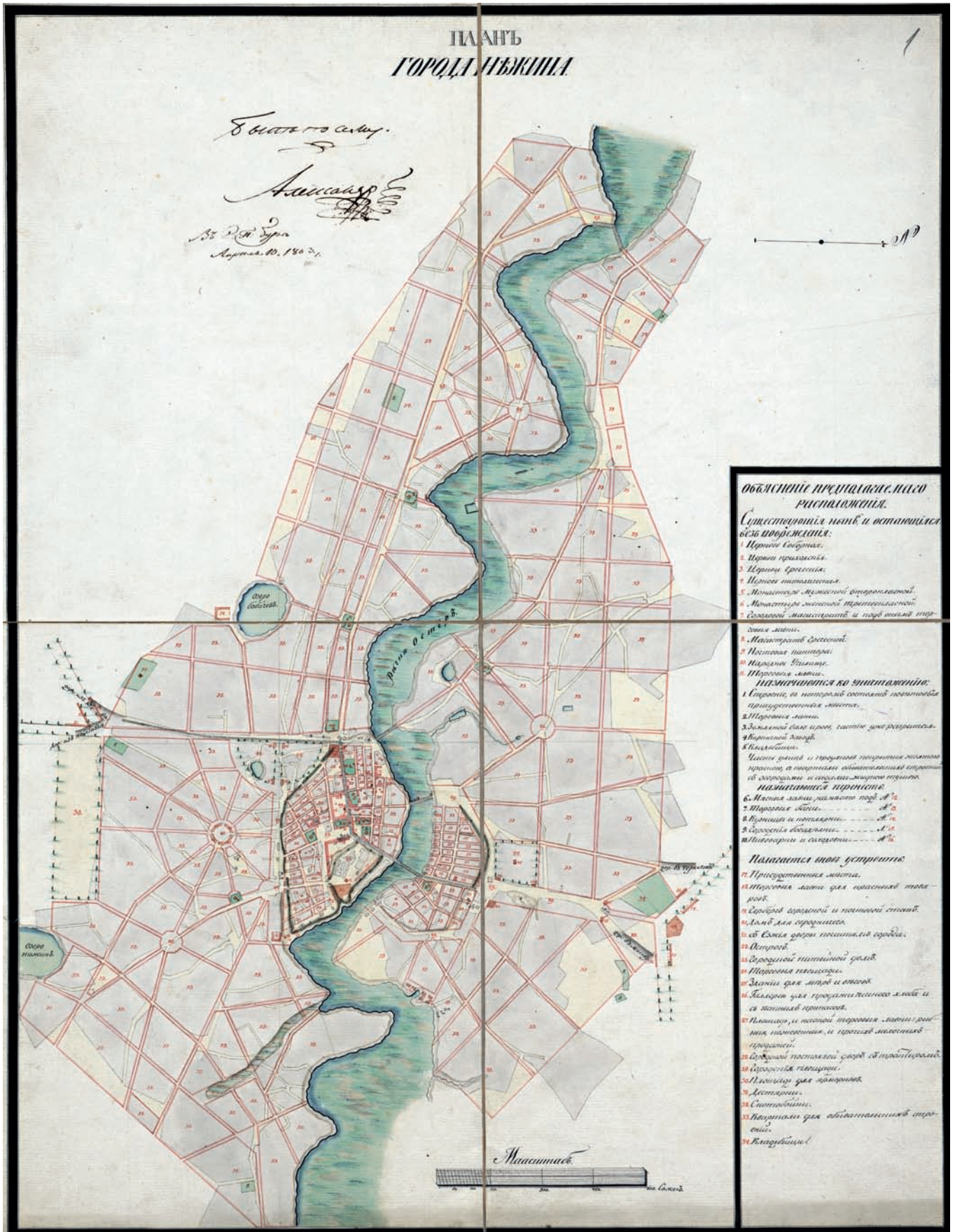
Рис. 2. План города Нежина, подтвержден 10 апреля 24 мая 1803 года. Публикуется впервые