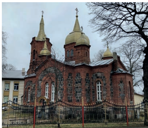
Рис. 4. Муствез, Эстония. Троицкая церковь. Архитектор Я. Бауманис. 1875–1878 годы.