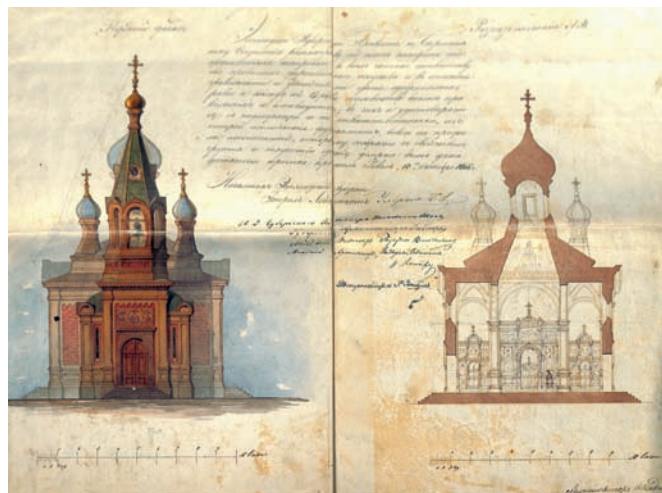
Рис. 2. Васкнарва, Эстония. Ильинская церковь. Проект. Фрагмент. Архитектор И.П. Маас 1867–1873 годы