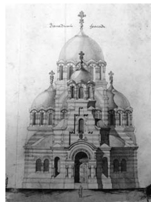
Рис. 5. Вильнюс, Литва. Знаменская церковь. Проект. Фрагмент. Архитектор М.М. Прозоров. 1899–1903 годы