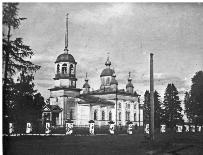
Рис. 6. Церковь Рождества Христова в Прилуцком приходе. 1869–1874 годы

История церквей Прилуцкого прихода, реконструированная по письменным документам и изобразительным источникам, раскрывает богатое типологическое многообразие шатровых и кубоватых церквей, дополняет картину бытования