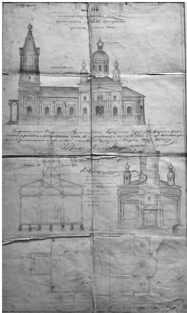
Рис. 5. Проект на постройку деревянной на каменном фундаменте церкви Прилуцкого прихода Онежского уезда. 1866 год