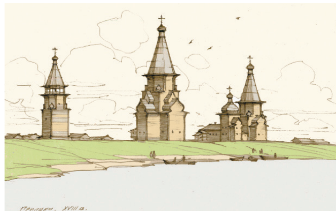
Рис. 2. Ансамбль Прилуцкого погоста в XVIII веке. Графическая реконструкция А.Б. Бодэ