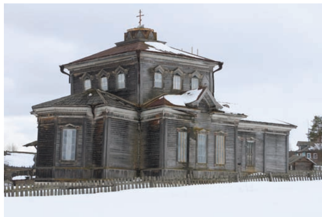
Рис. 7. Церковь Казанской иконы Божией Матери в деревне Большая Фёхтальма (1904–1907). Архитектор А.А. Каретников. 2019 год