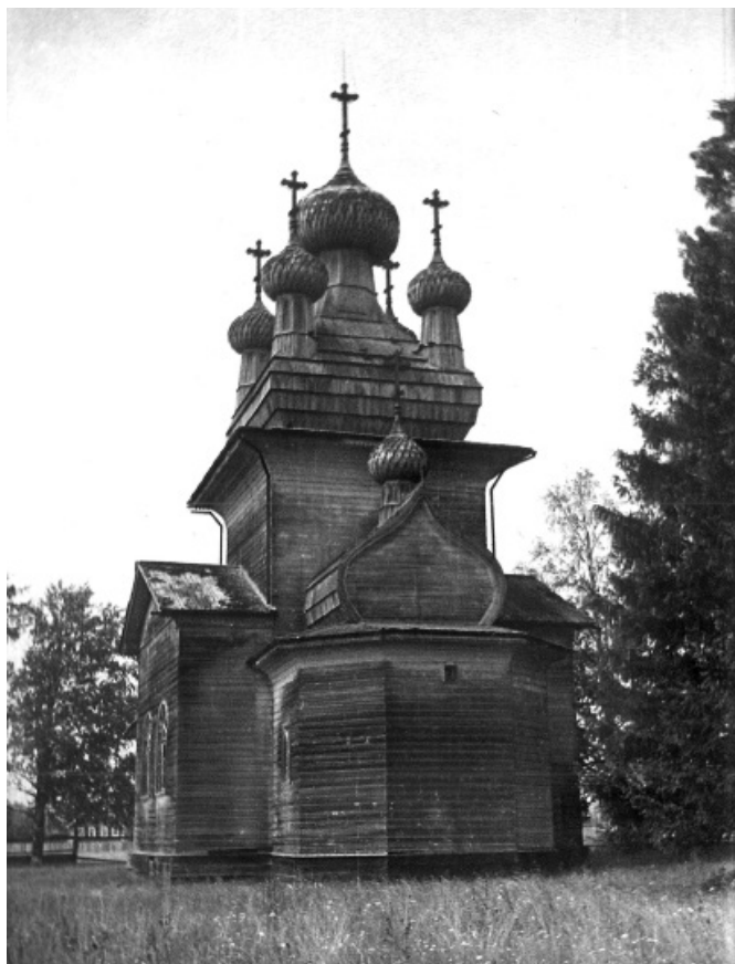
Рис. 5. Церковь во имя Тихвинской иконы Божией Матери. Онежский район, село Ряхковское (Верховье, Мудьюг). 1865 год

и папертью – 12 саж., ширину – 6 саж., два окна в алтаре, 5 – в церковной части, 6 – в трапезной части, одни двери столярной работы 34 . В 1829 году церковь была перекрыта новым тёсом и окрашена (указ от 30 апреля), но из-за недостатка тёса и краски, купол, трапезная часть с папертью остались не перекрыты и не окрашены 35 . Эти ремонтные работы были выполнены в 1834 году 36 . По данным на 1842 год, внутри церкви стены были обиты шпалерами, пол деревянный, столбы в