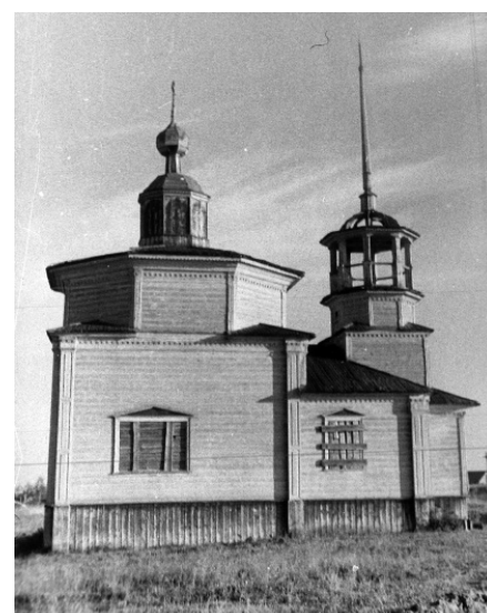
Рис. 8. Часовня во имя Смоленской Божией Матери. Вид с севера. Онежский р-н, село Верховье. Конец XIX века