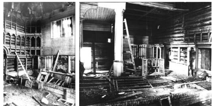
Рис. 4. Церковь Входа в Иерусалим. 1753–1758 годы. Интерьер. Погост Верхний Мудьюг. Онежский р-н, село Верхний Мудьюг