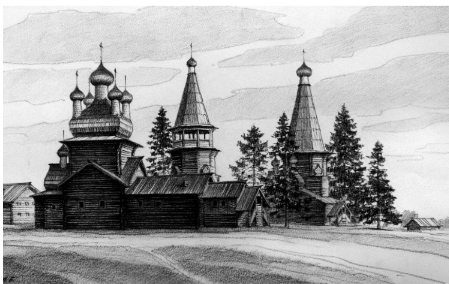
Рис. 7. Храмовый комплекс села Верхняя Мудьюга. Графическая реконструкция облика конца XVIII века. Рисунок. А.Б. Бодэ